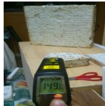
Equipo de Trabajo.