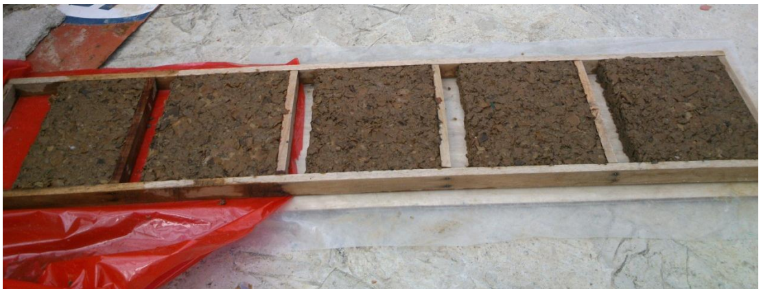
1er día de secado paneles de cartón.