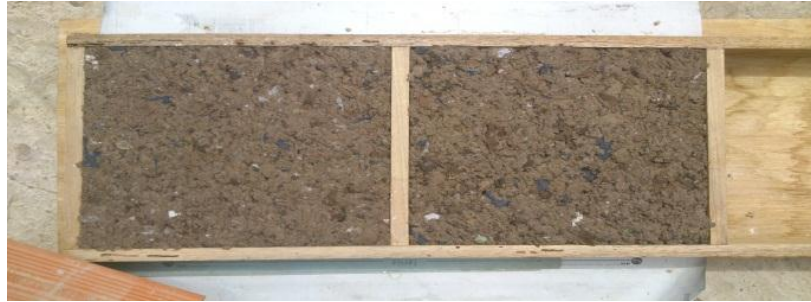
2do día de secado paneles de cartón.