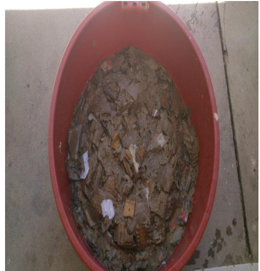
Pulpa de cartón .