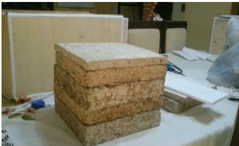
Paneles elaborados .