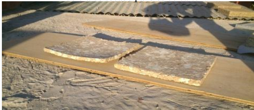
Deformaciones en paneles de espesor 2cm.