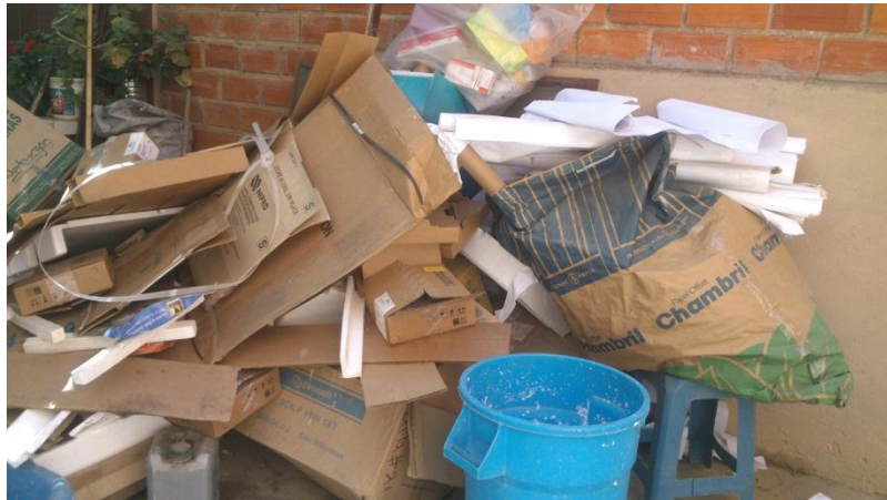
Papel y Cartón recolectado