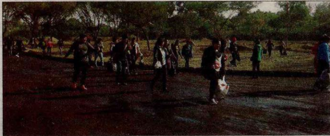
Los universitarios durante el recorrido de limpieza.

De acuerdo con información proporcionada a NUEVO SUR, el motivo que llevó a los estudiantes de la Carrera de Administración realizar la campaña fue que a muchos (universitarios) se le olvidó la tarea de cuidar el medio ambiente, de pensar en el medio en el que vivimos, de poder preservar este territorio con campañas solidarias hacia este lugar.