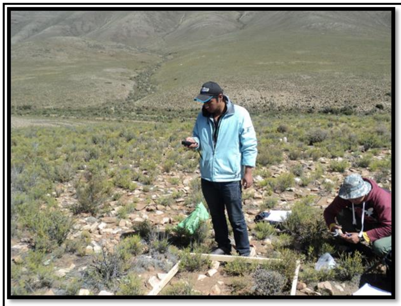
Identificación de la CANAPA Kanllar Tholar en una parcela de muestreo de la comunidad de Chilcayo