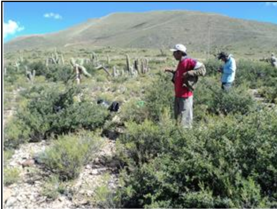
Identificación de especies deseables, poco deseables e invasoras en la comunidad de Curqui.