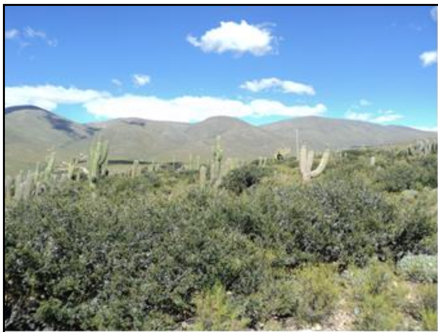
CANAPA Churquial Tholar en la comunidad de Curqui