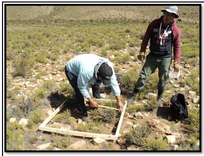
Toma de datos (diámetro de follaje) de las especies dentro el cuadro real