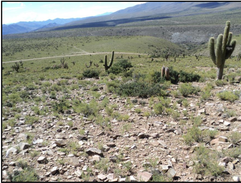
CANAPA Tholar Pajonal de la comunidad de Curqui