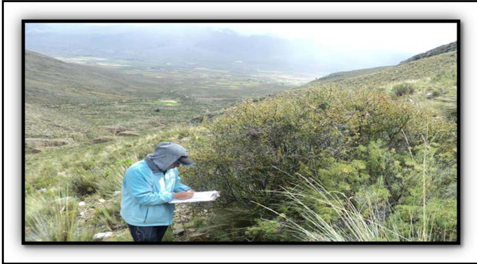
Llenado de planilla 1(características de la especie vegetal)