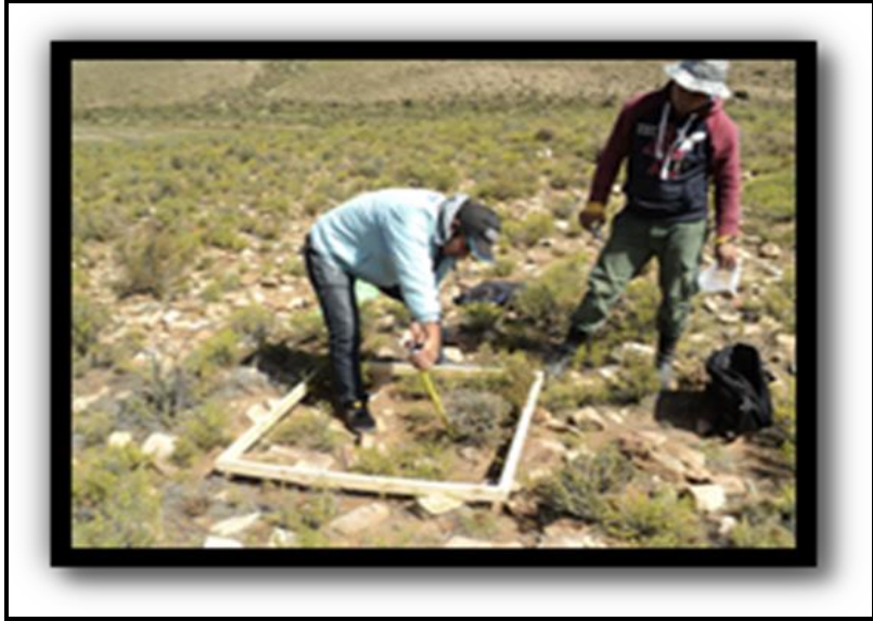
Medición de altura de las especies vegetales dentro del cuadro real