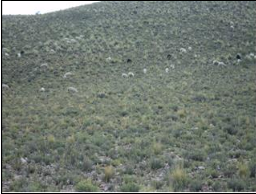
CANAPA Pajonal Alpino de la comunidad de Chilcayo