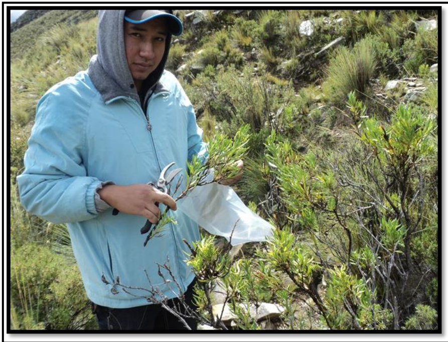
Obtención de la muestra de vegetación para su identificación