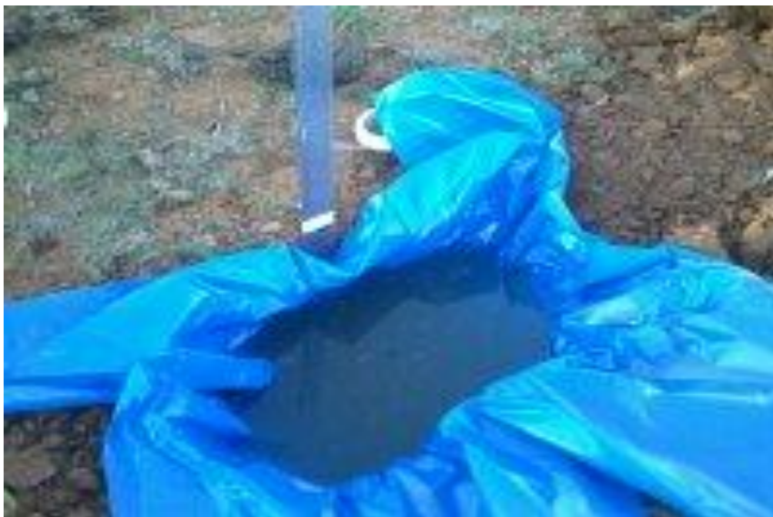
Comienzo de control del tiempo de infiltración