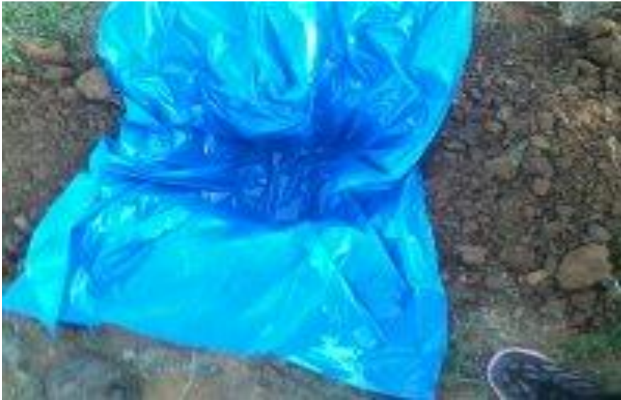
Preparación para la prueba de infiltración