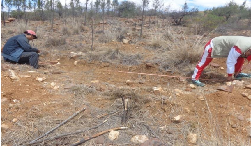
Medición de largo de la zanja