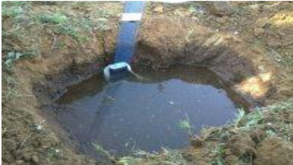
Segundo enrase del la prueba de infiltración