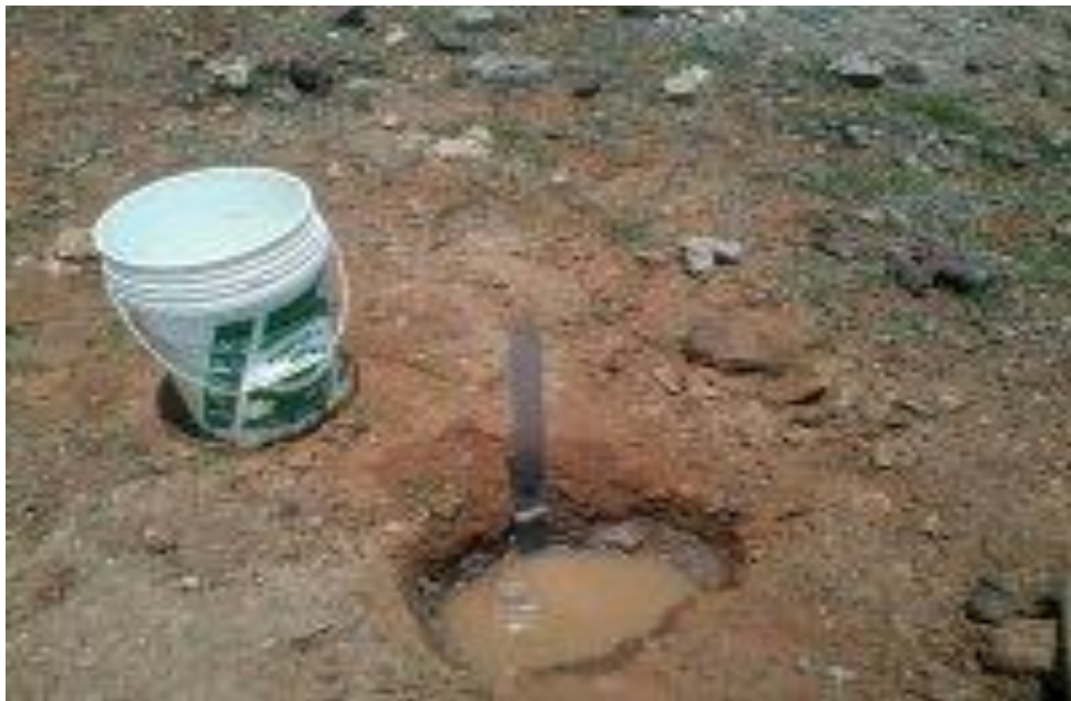
Final de la prueba de infiltración