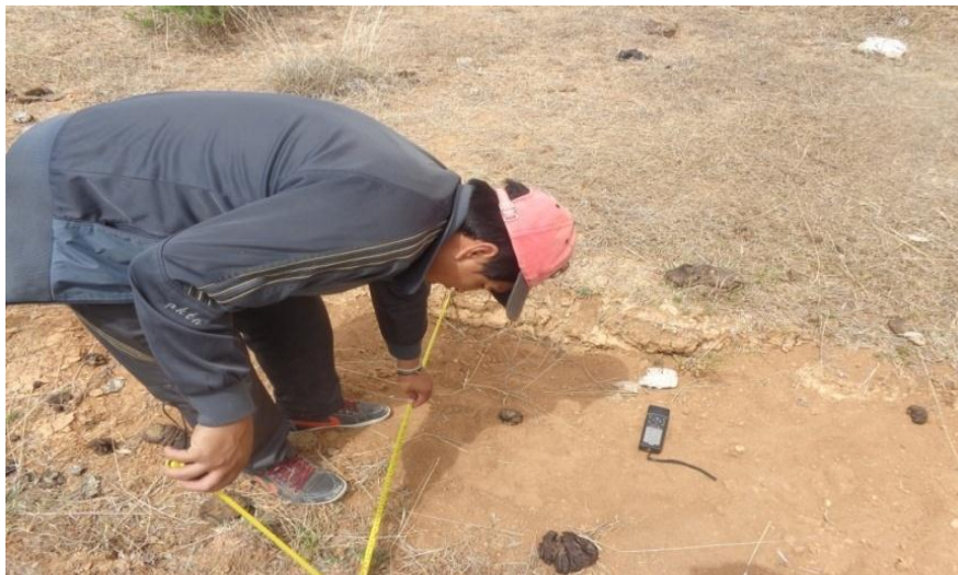
Medición de la base y coordenadas de las zanjas