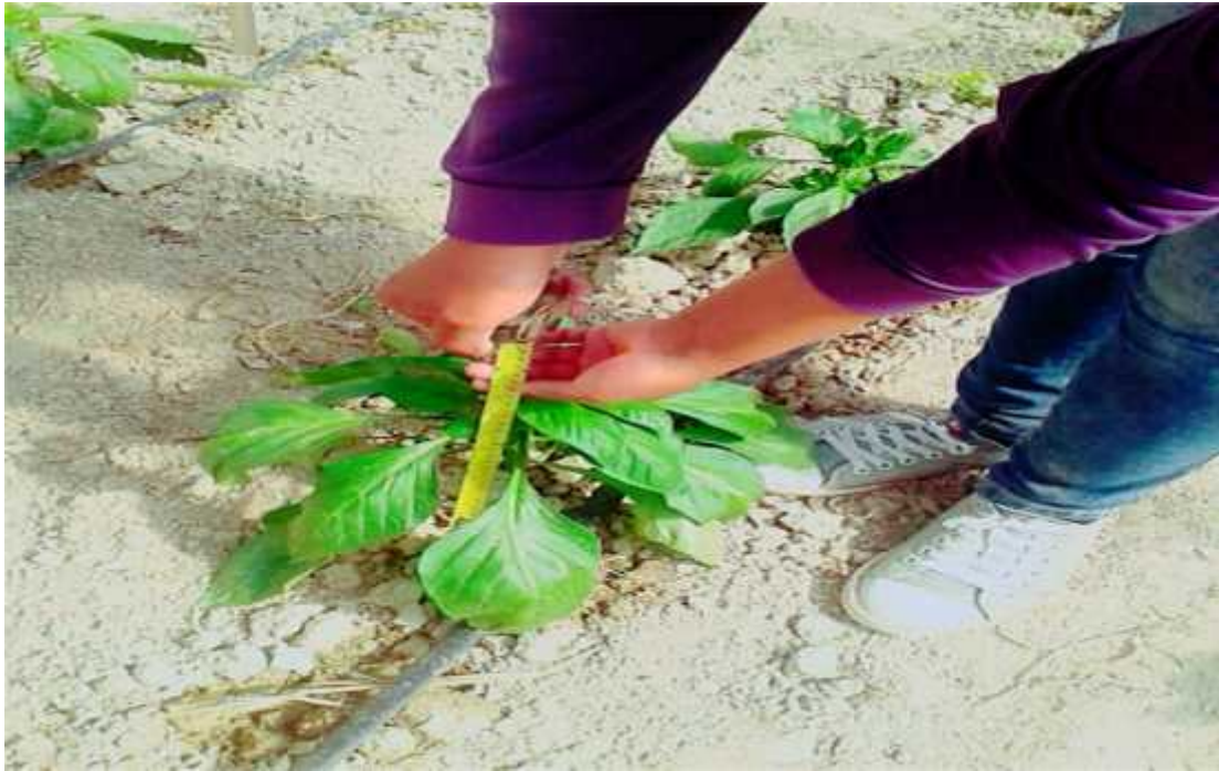
Aplicación del abono en el aporque