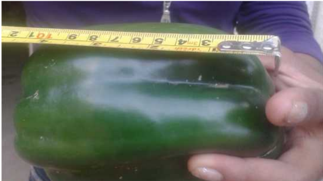
Peso del fruto por planta