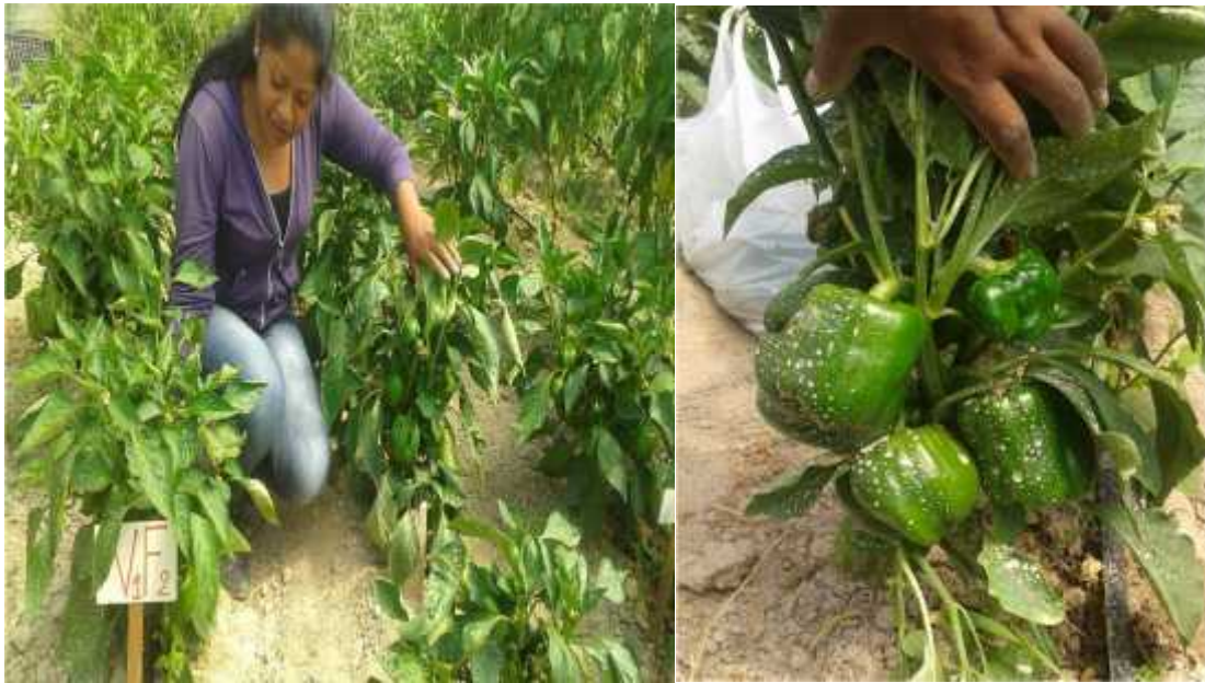
Recoleccion por planta