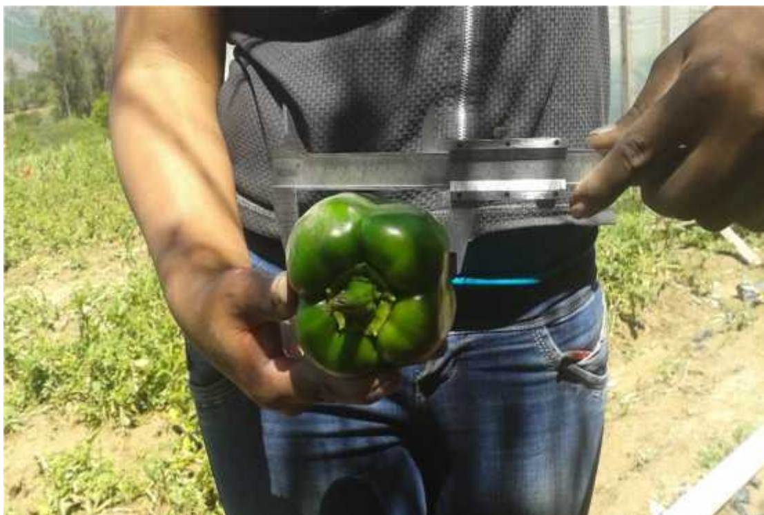
Longitud del fruto