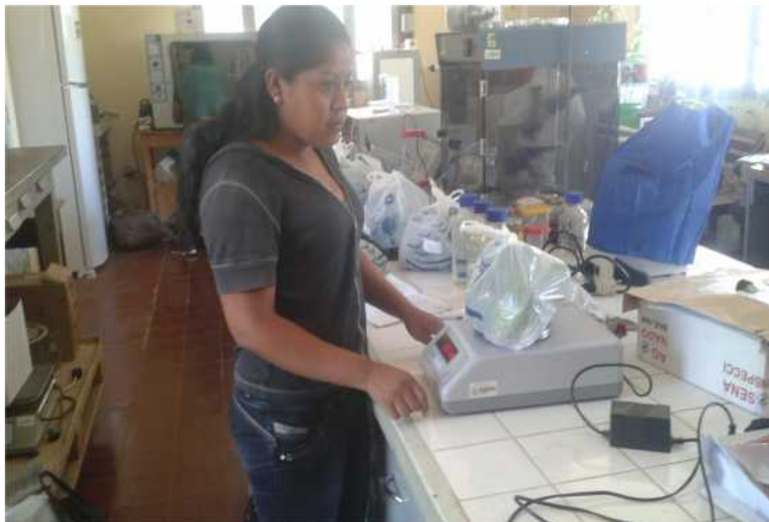
Frutos por planta