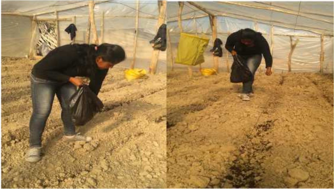
Aplicación del abono antes del trasplante