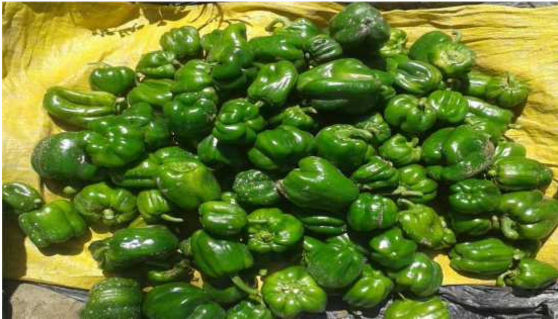
Diámetro del fruto