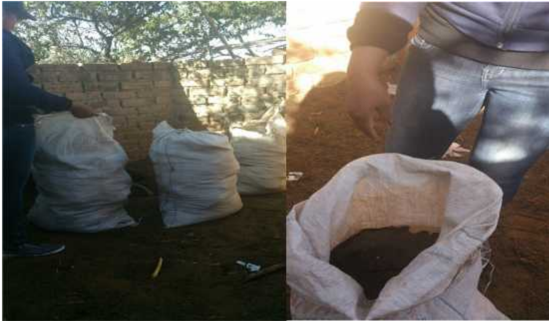
Recolección del estiércol de ovino del corral