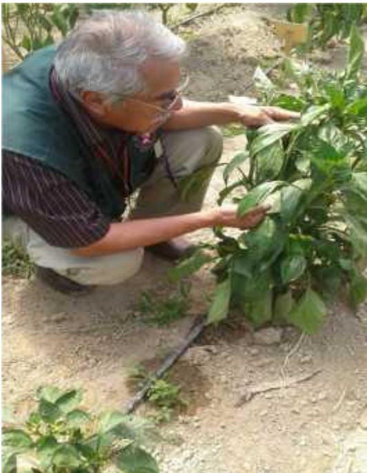
Recolección del fruto