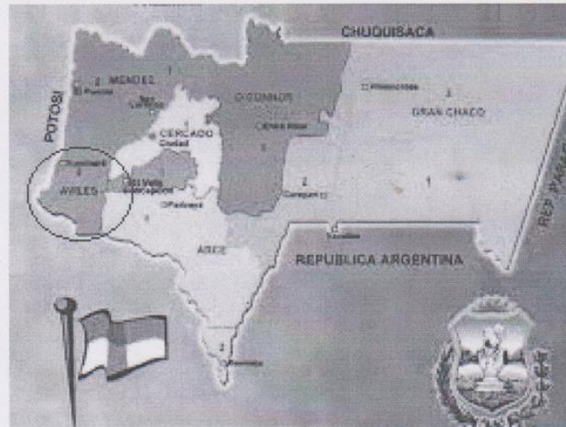
Figura Nº 1. UBICACIÓN DEL CENTRO CEVITA