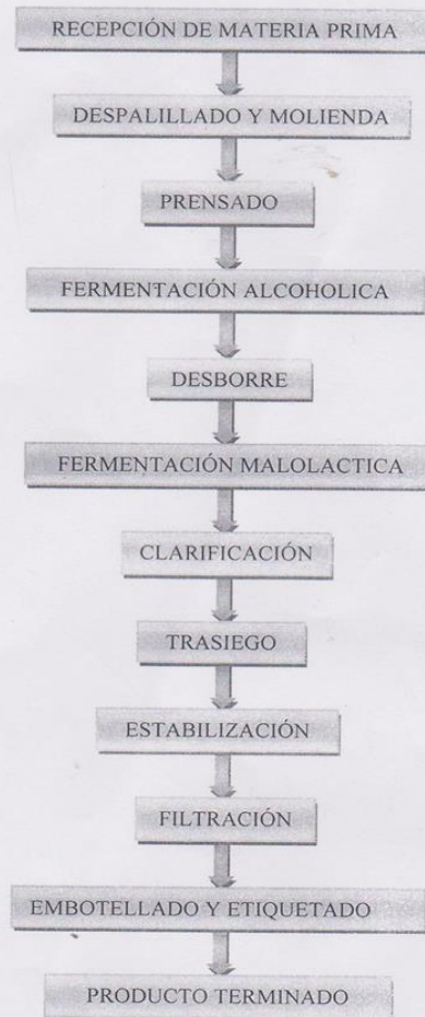
DIAGRAMA DE FLUJO PARA ELABORACIÓN DE VINO BLANCO MOSCATO