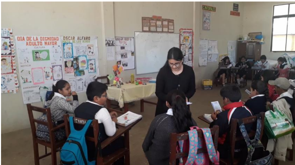
Momento en el que se les entrega a los estudiantes tanto las gomitas como los trípticos.