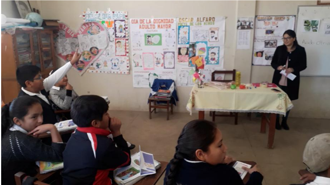
Momento en que los estudiantes formularon las preguntas relacionadas con la explicación y la actividad realizada.