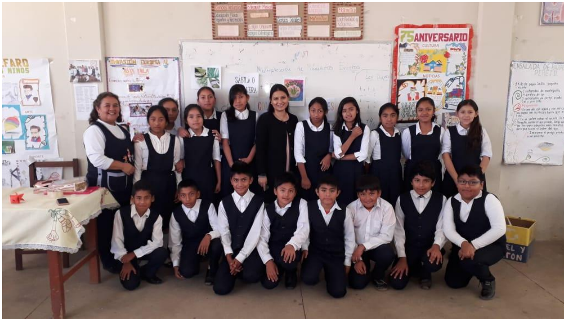
Fotografía realizada al finalizar la actividad con todos los estudiantes en compañía de la maestra de grado.