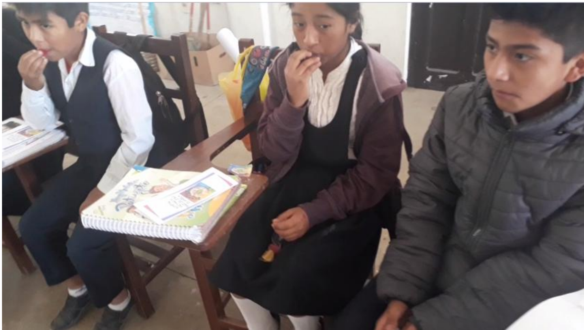
Los estudiantes realizando la degustación de las gomitas.