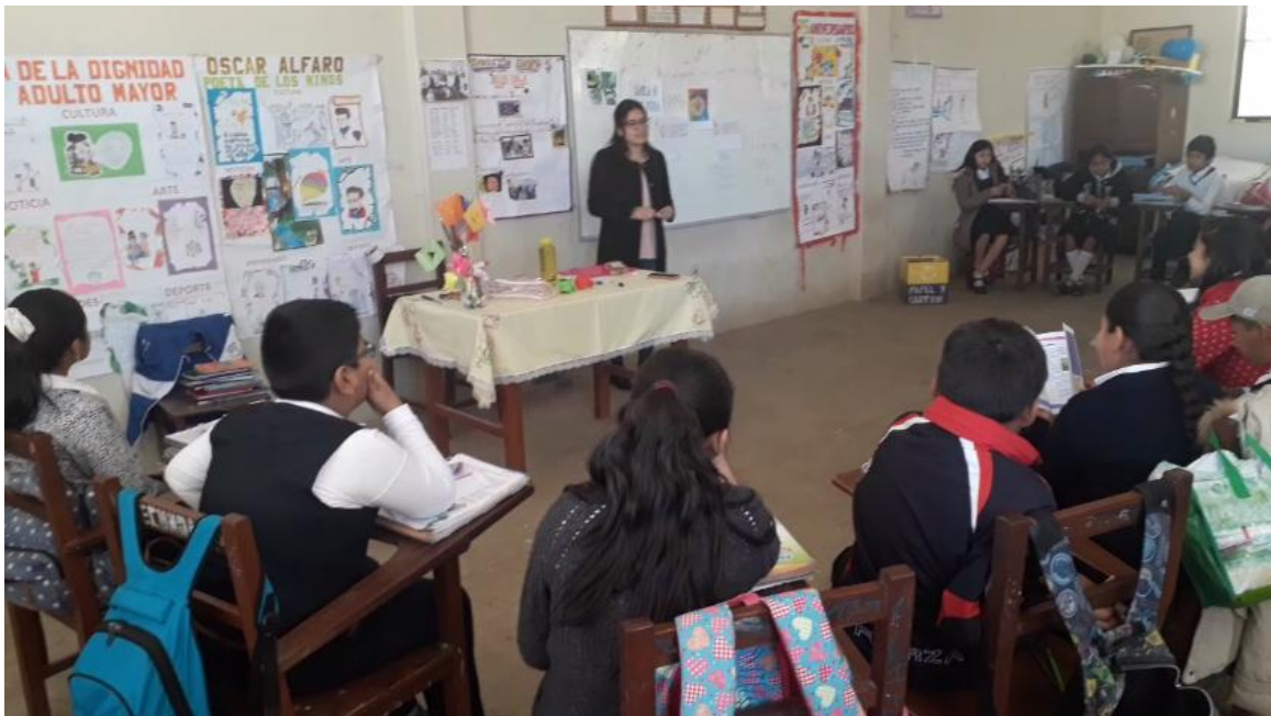
Explicación inicial de la actividad a los estudiantes.