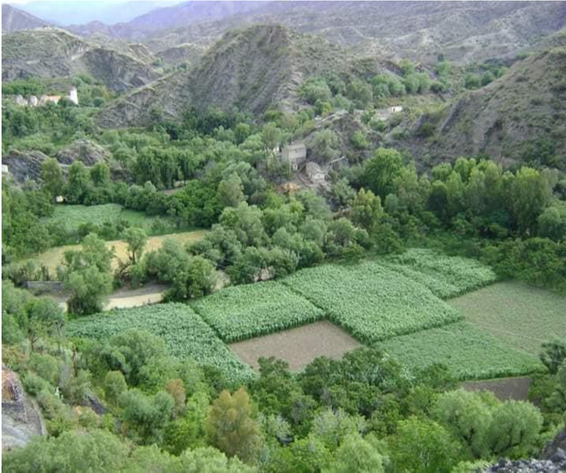
Vista panorámica del Cantón de Paicho, municipio El Puente.