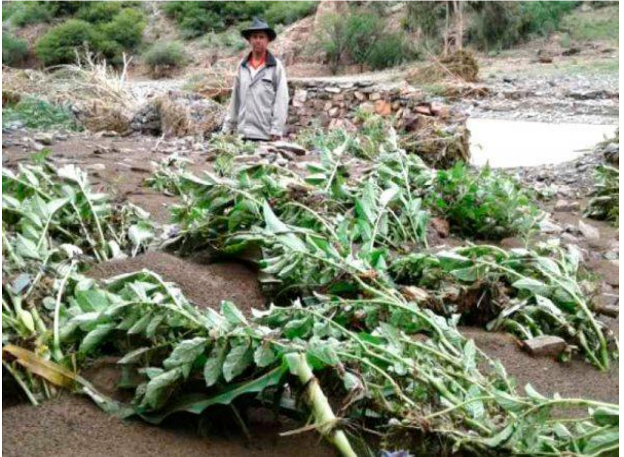
Desastre natural el año 2017 que afecto con el 80 % de la producción agrícola y frutícola del Cantón de Paicho.