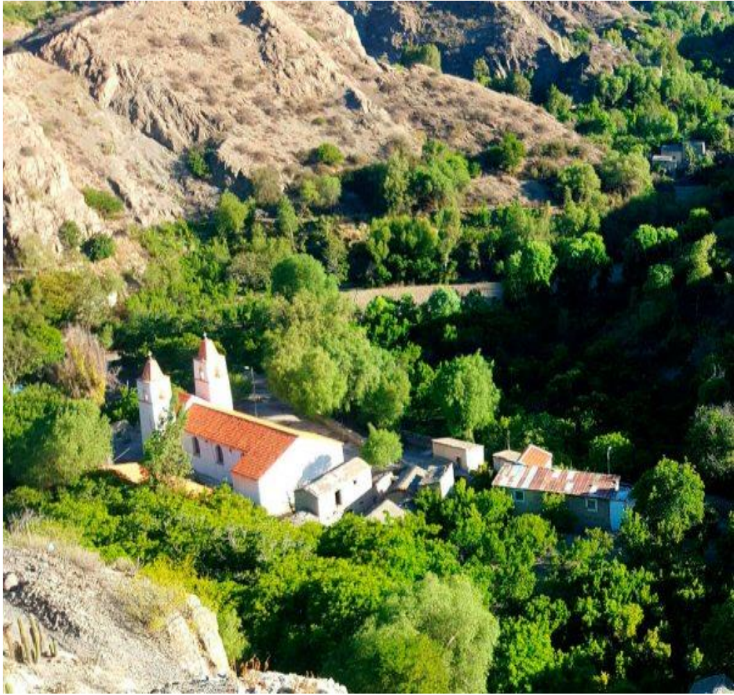
Paicho Centro donde está localizada la iglesia que cuenta con 110 años, de su fundación.