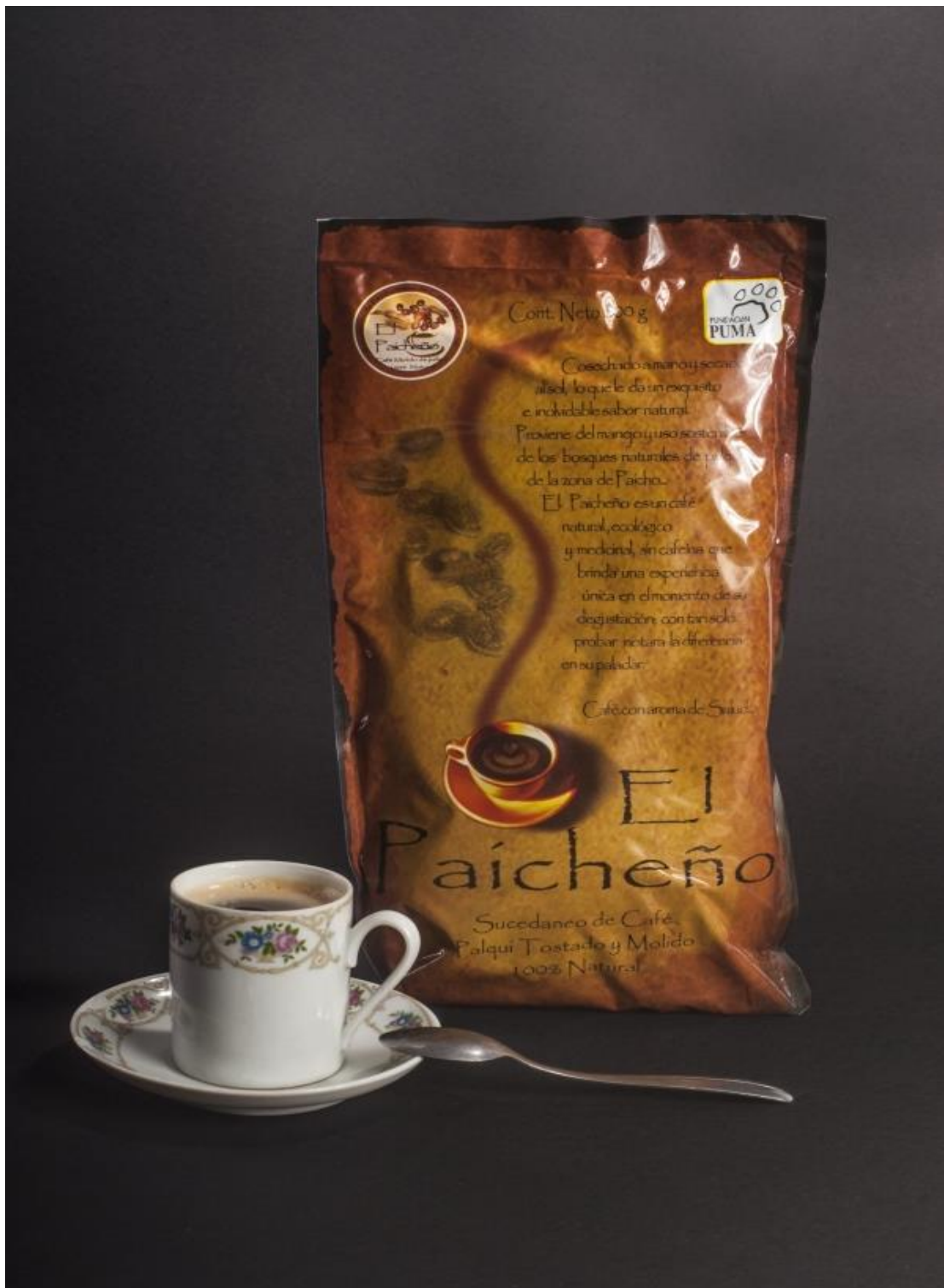
CAFÉ EL PAICHEÑO, una nueva alternativa para el café hecho de palqui.