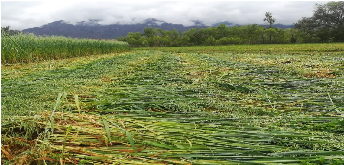
Anexo 6. Fotografía del Peso de la Materia Verde