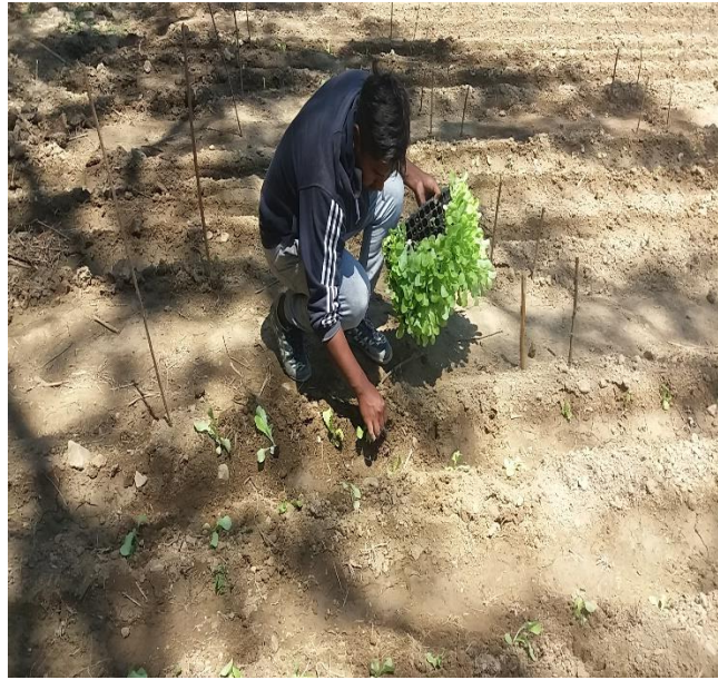
trasplante a campo abierto