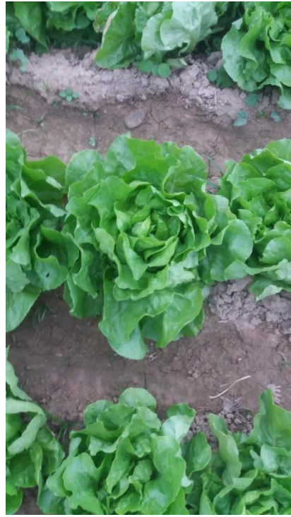
Dark Oreen Boston (señorita)