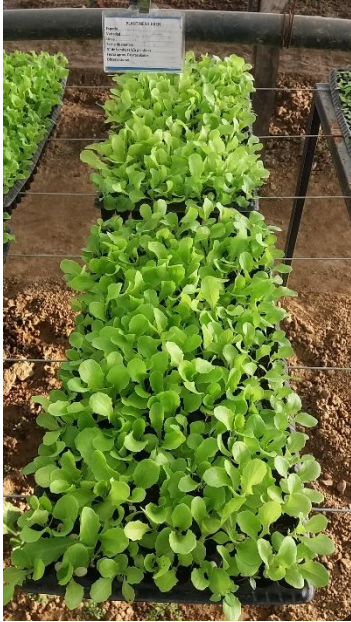
Plantines para el trasplante