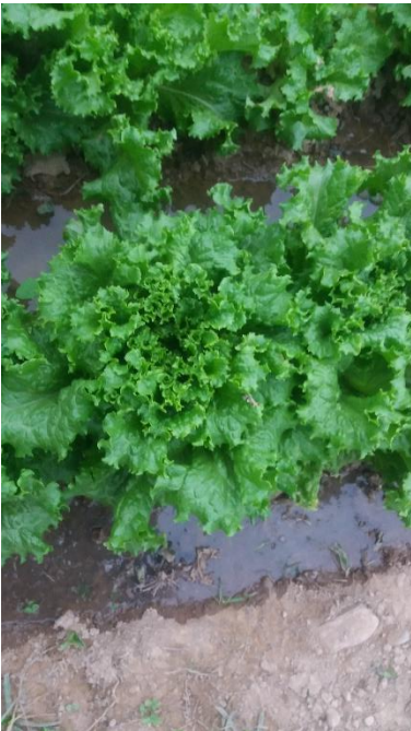
Grand Rapids TBR (samba)