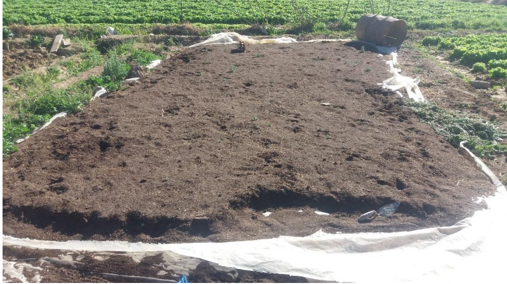
Preparación del sustrato