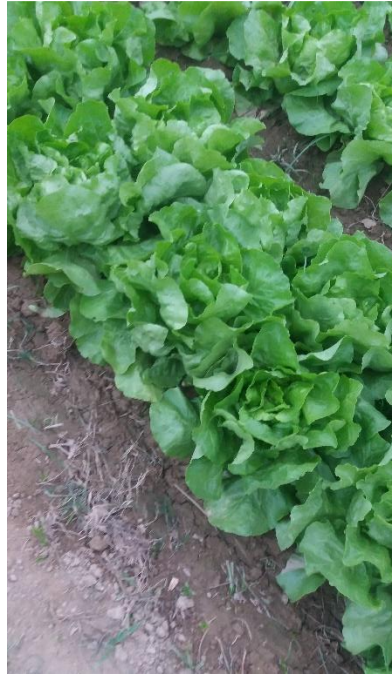
White Boston (señorita)