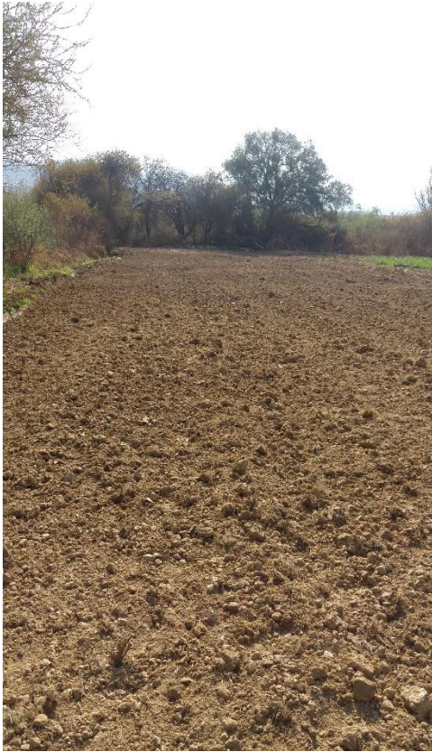
Preparación del terreno