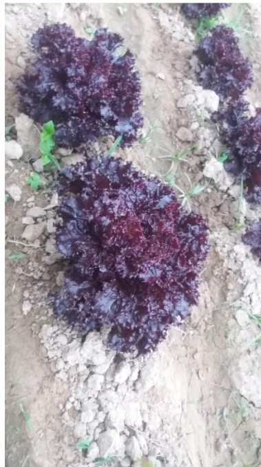
Lollo Rosso (morada oscura)