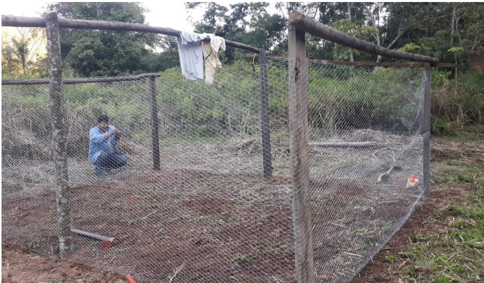
Anexo N°7 Desinfección del sustrato.