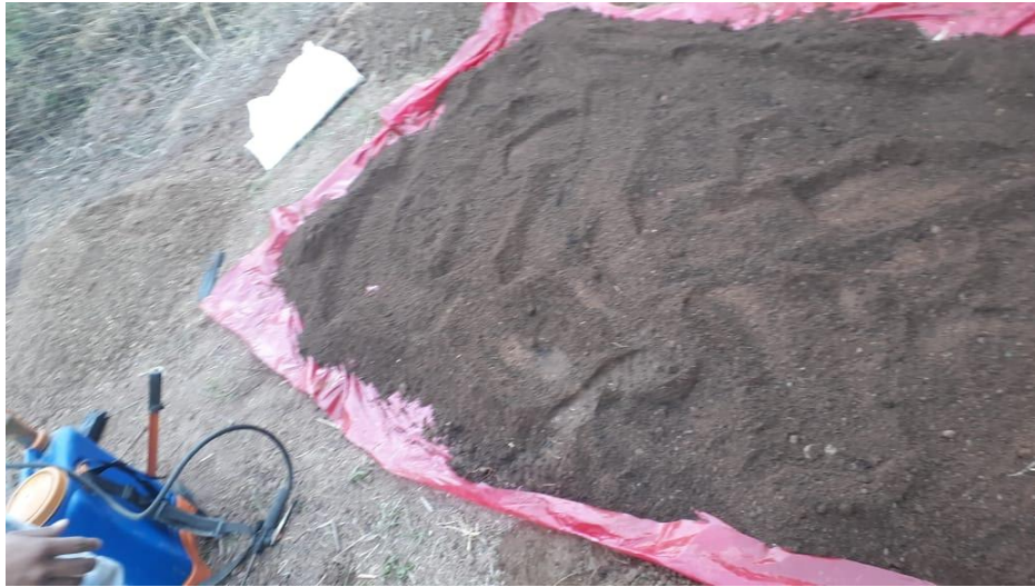
Anexo N°8 Llenado de bolsas.