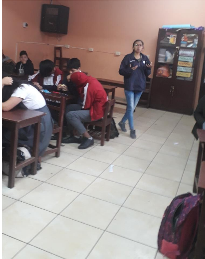
“JESÚS DE NAZARETH”