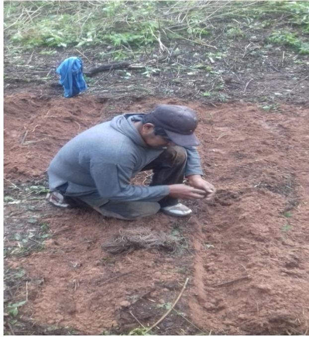
ANEXO N° 8 EMISION DE LOS PRIMEROS BROTES.