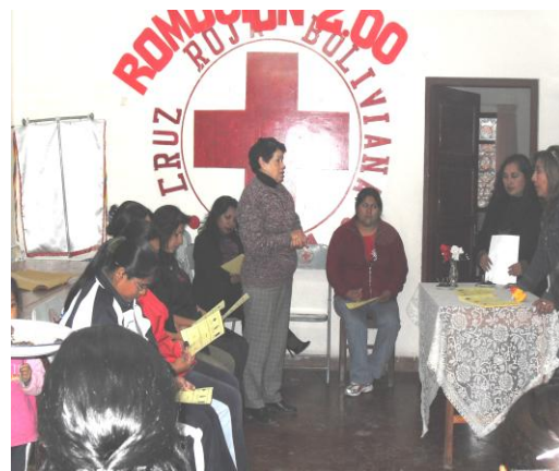
PADRES DE FAMILIA DE LA UNIDAD EDUCATIVA MANUEL BELGRANO