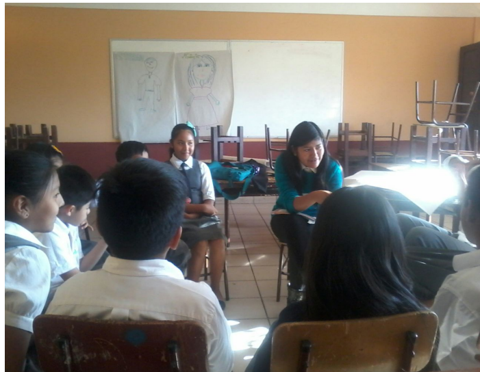
Desarrollo del grupo focal a los estudiantes de 5 to de primaria del colegio “Bernardo Navajas Trigo”