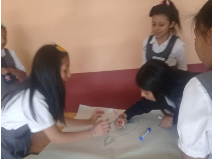
Aplicación del grupo focal a estudiantes de 5 to de Primaria del colegio Bernardo Navajas Trigo