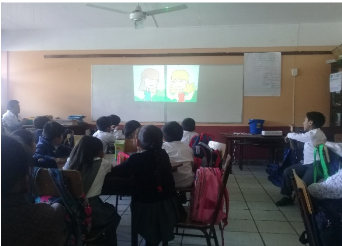
Niños del 1 ro B de primaria, viendo el video “ La niña que no quería bañarse ”