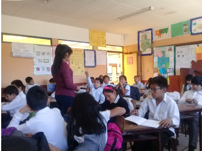
Actividad: Unidad en la diversidad , estudiante levantando la mano para participar.