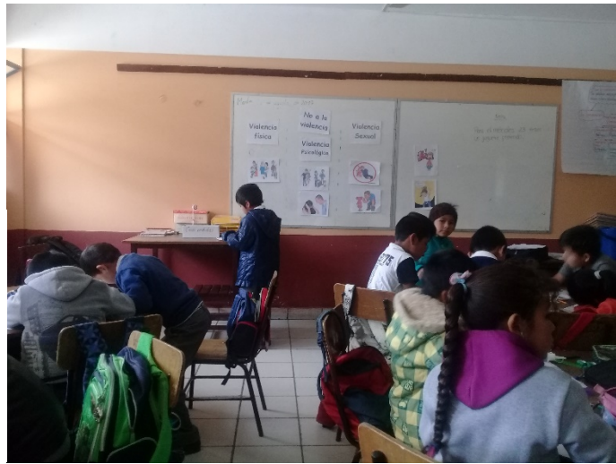
Actividad: Resolviendo algunas situaciones , estudiantes de 2 do B, participando de la actividad.