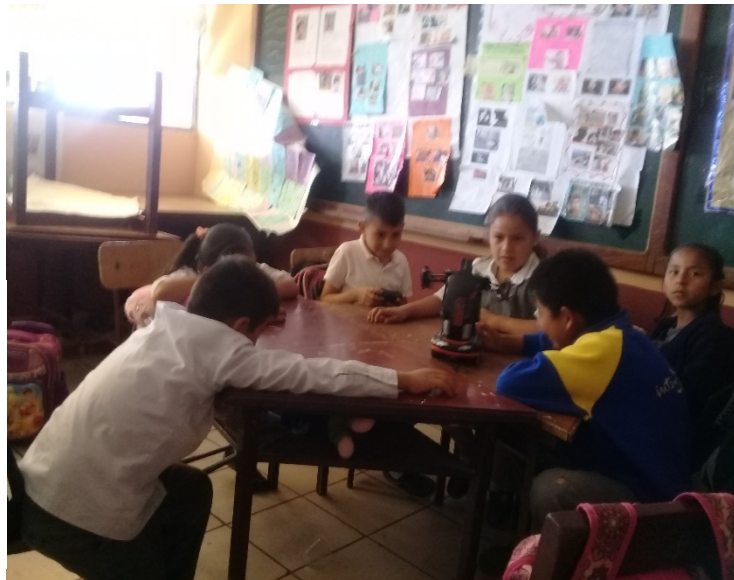
Actividad: Juguetes preferidos , estudiantes del 3 ro B, intercambiando juguetes.