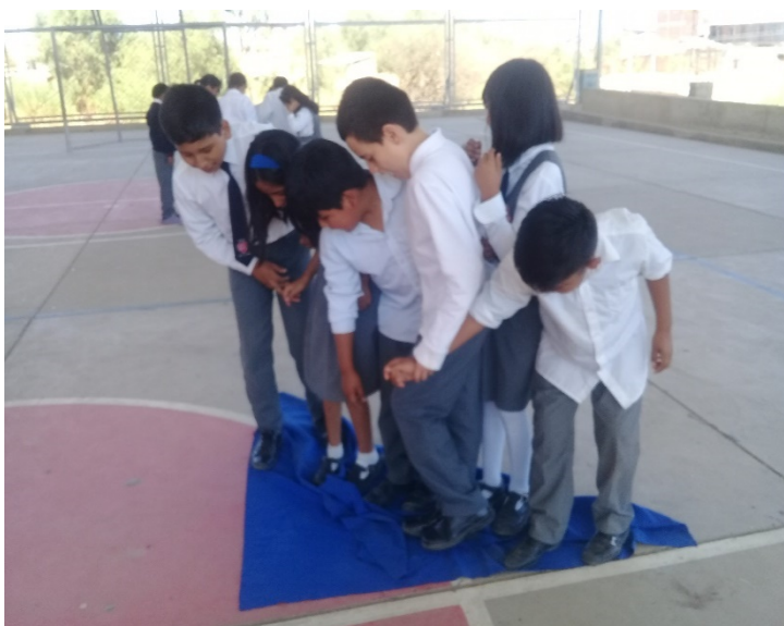
Actividad: Dar la vuelta la tela , estudiantes del 4 o A, trabajando en equipo para dar la vuelta la tela.