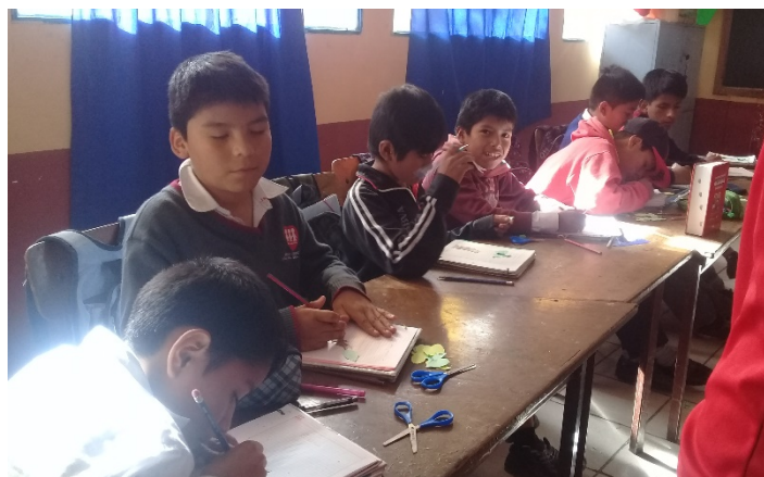
Actividad: Mi árbol personal , estudiantes de 6 to A, realizando sus árbol con hojas amarillas y verdes.