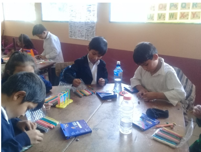
Actividad: Manejo de emociones . Estudiantes del 2° B, jugando con plastilina.