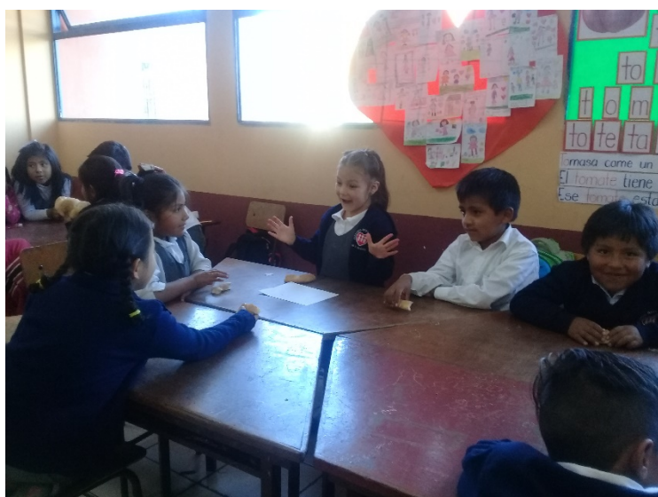
Actividad: Planificando mi familia , estudiantes de primero de primaria, distribuyendo el pan a los integrantes se du grupo.