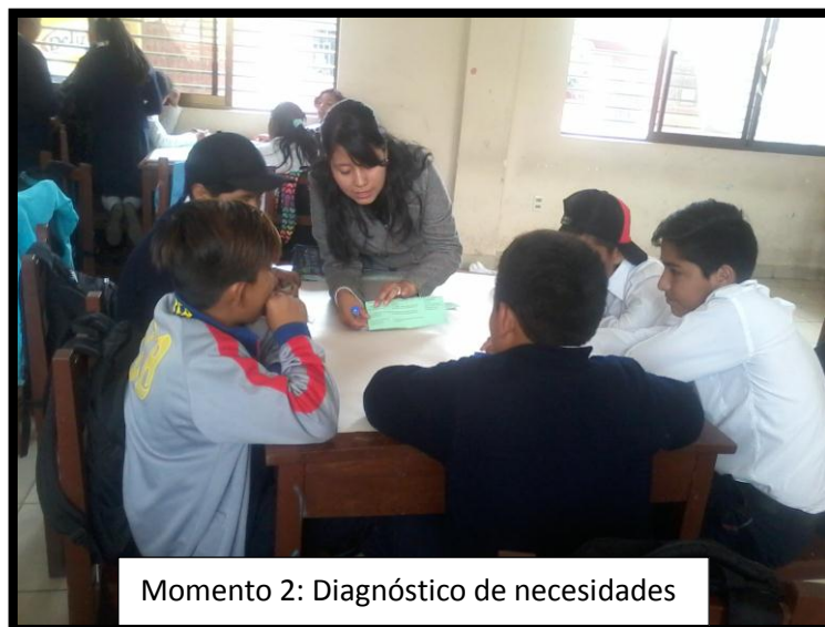
Momento 2: Diagnóstico de necesidades