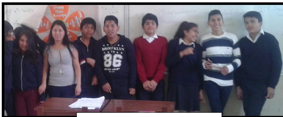
Momento 6: Cierre del proceso educativo