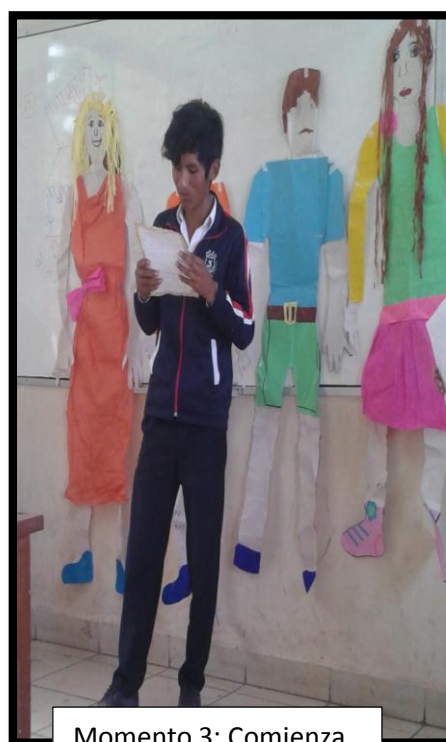
Momento 3: Comienza la historia.