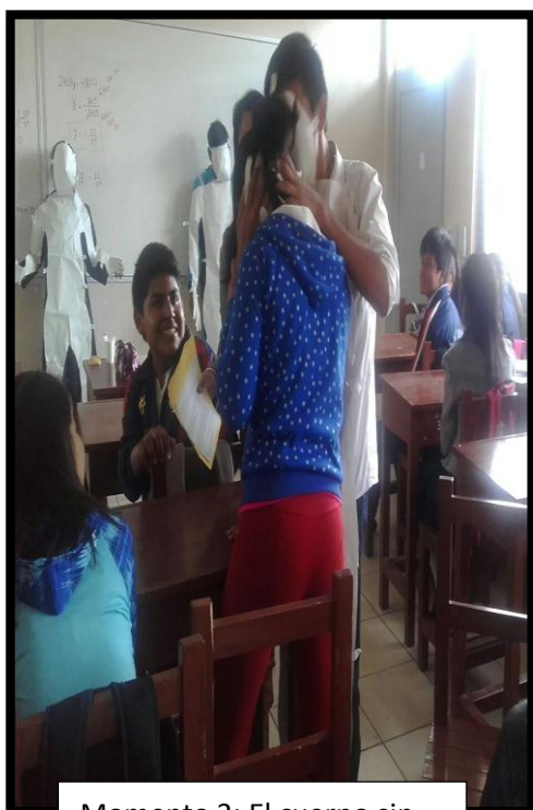
Momento 3: El cuerpo sin cuerpo.