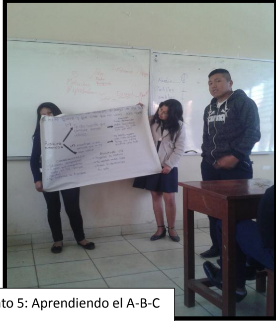
Momento 5: Aprendiendo el A-B-C