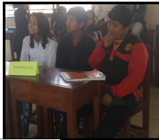
Momento 4: La recepción