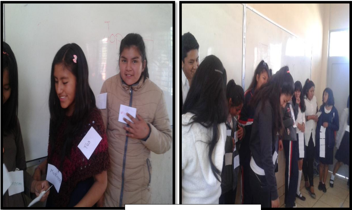
Momento 5: Todo lo que me dicen