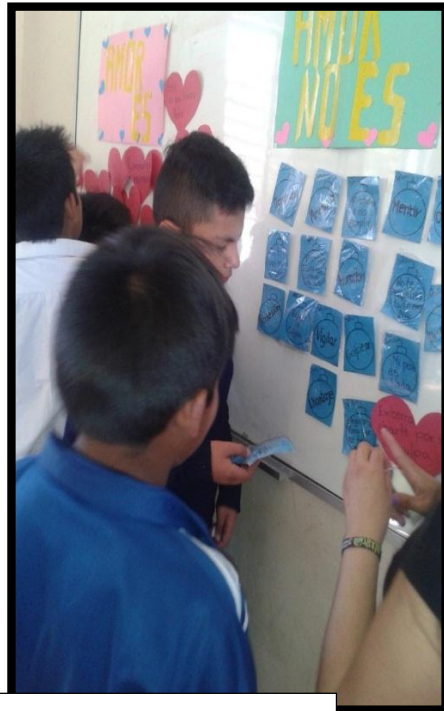
Momento 4: ¿Enamorados o en peligro?