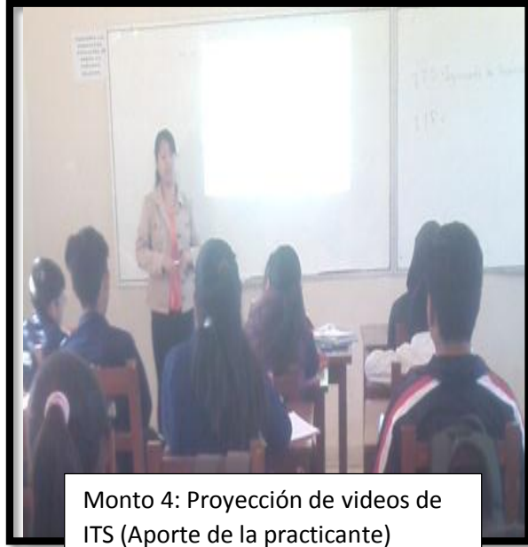
Momento 4: Proyección de videos de ITS (Aporte de la practicante)