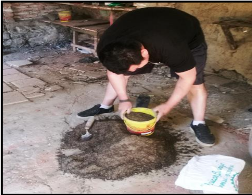
PREPARACION DEL GUANO DE CHIVO