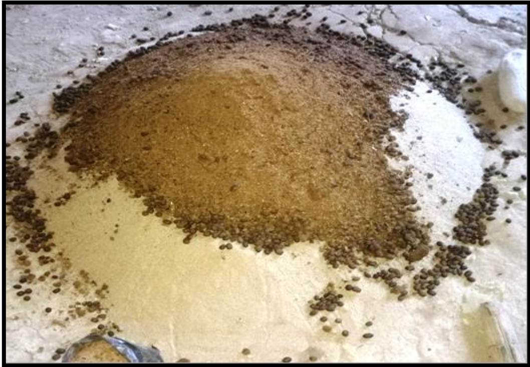
PREPARACION DEL ASERRIN