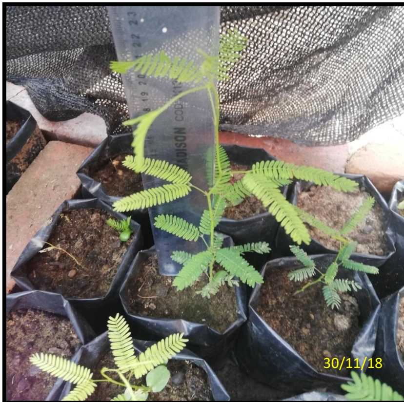
MUESTRAS FINALES DE CADA TRATAMIENTO