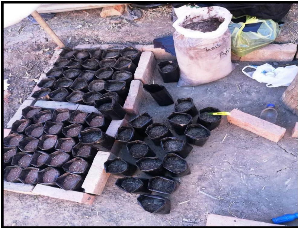
SEMBRADO DE SEMILLAS