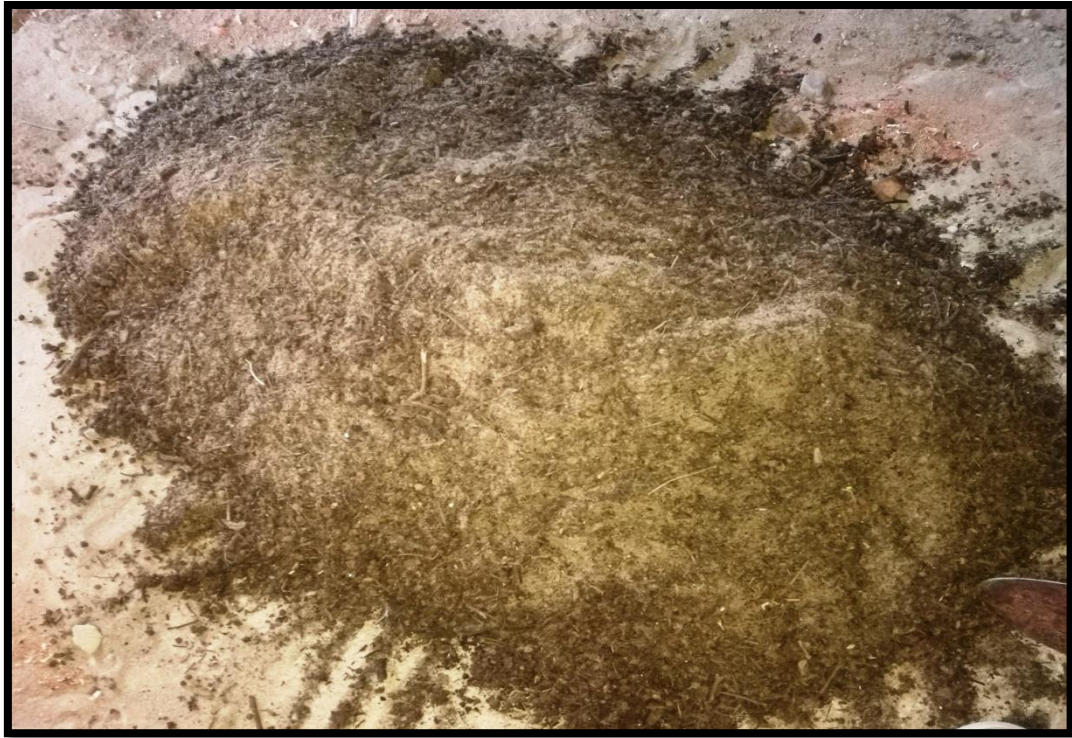
LLENADO DE BOLSAS