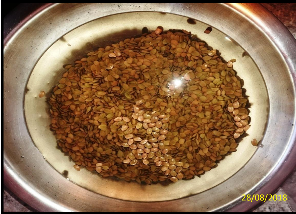
SEMILLAS REMOJADAS Y LISTAS PARA LA SIEMBRA