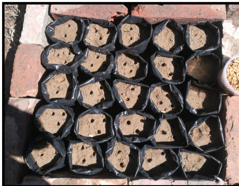
EVOLUCION DE LOS PLANTINES EN EL VIVERO