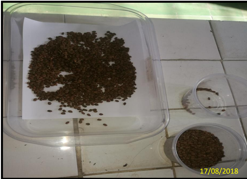
PESO DE SEMILLAS