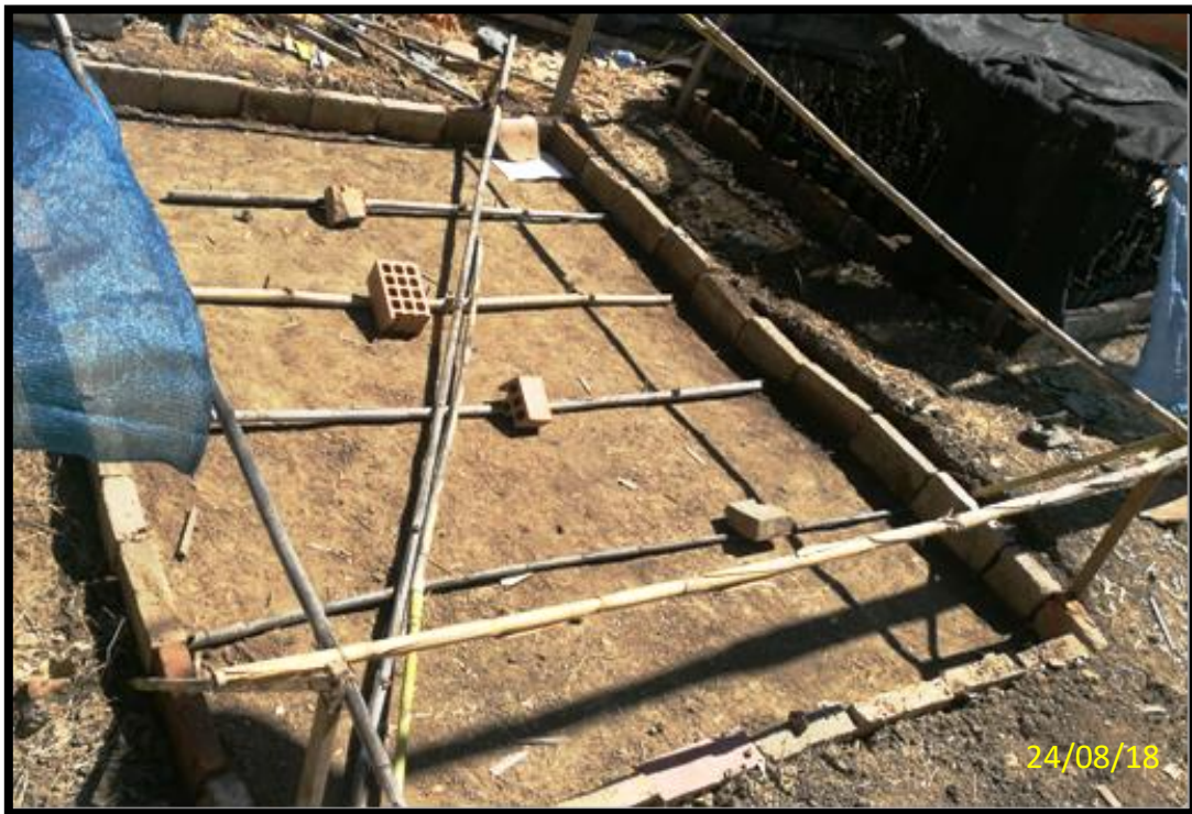
PREPARACION DEL SUSTRATO