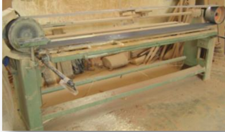
(Maquina del Lijado)