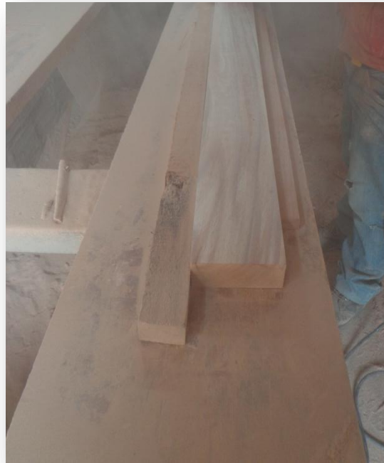
(Lijado de las Probetas)