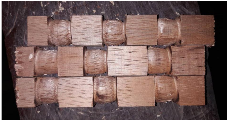
(Resultado final del Torneado)