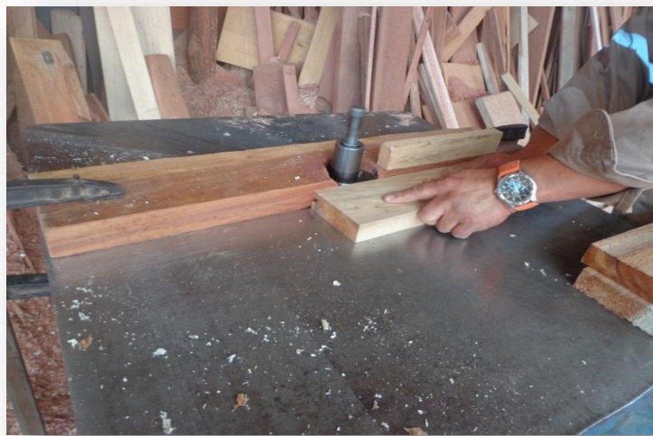
(Moldurado de Probetas)