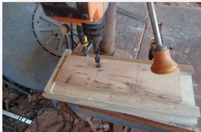
(Taladrado de Probetas)