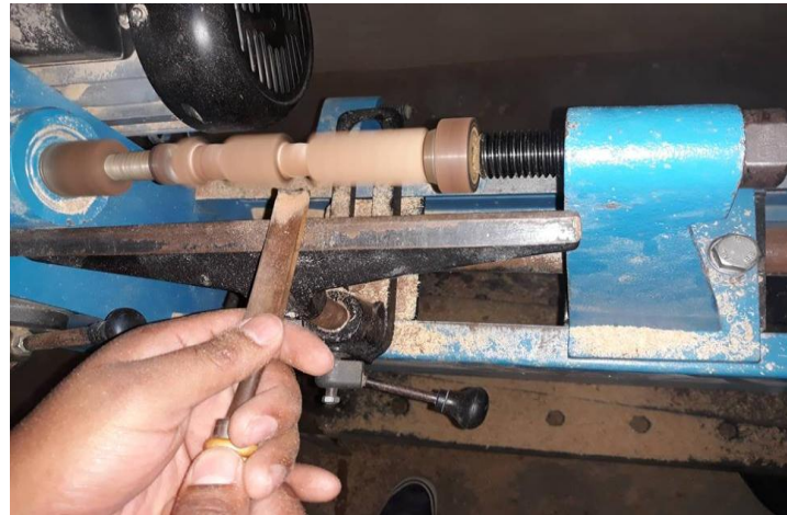
(Torneado de las Probetas)