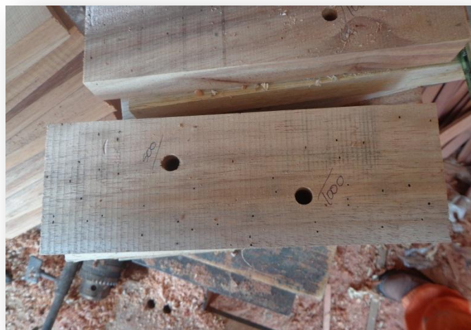
(Taladrado segun 500 y 1000 RPM)