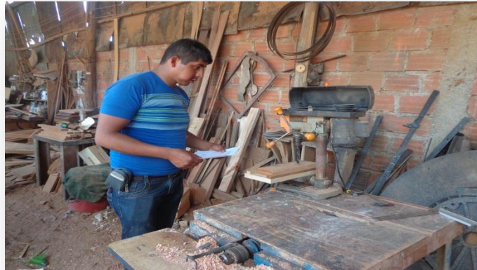
(Maquina de Taladro )