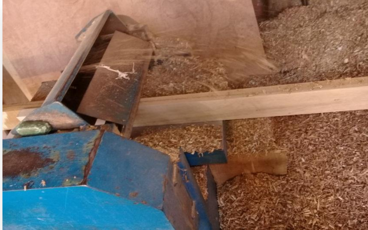
(Maquina Cepilladora Grosadora)