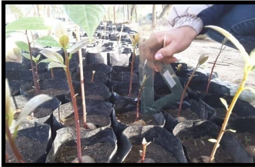
Medición de Alturas (cm)