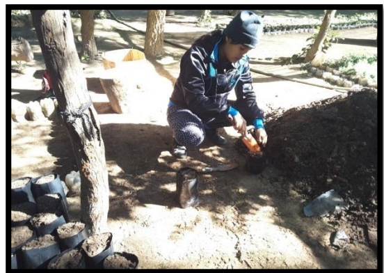
Ubicación de las bolsas polietileno en el vivero