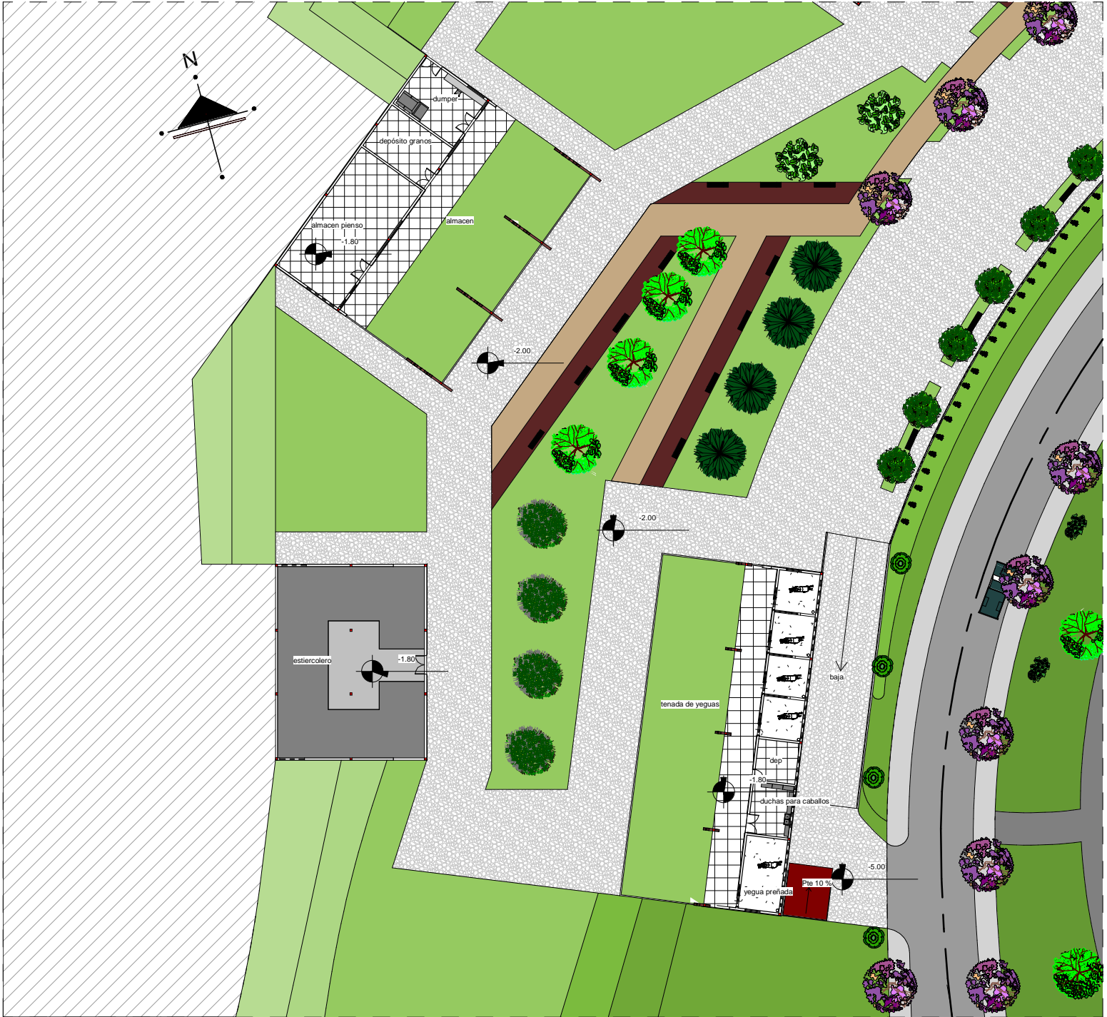
PLANTA BAJA AMOBLADA ESC 1 :500