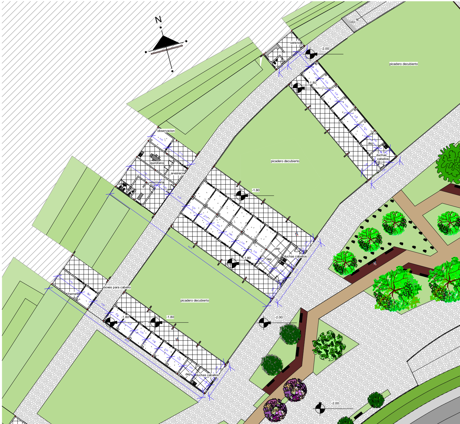
PLANTA BAJA ACOTADA ESC 1 :500