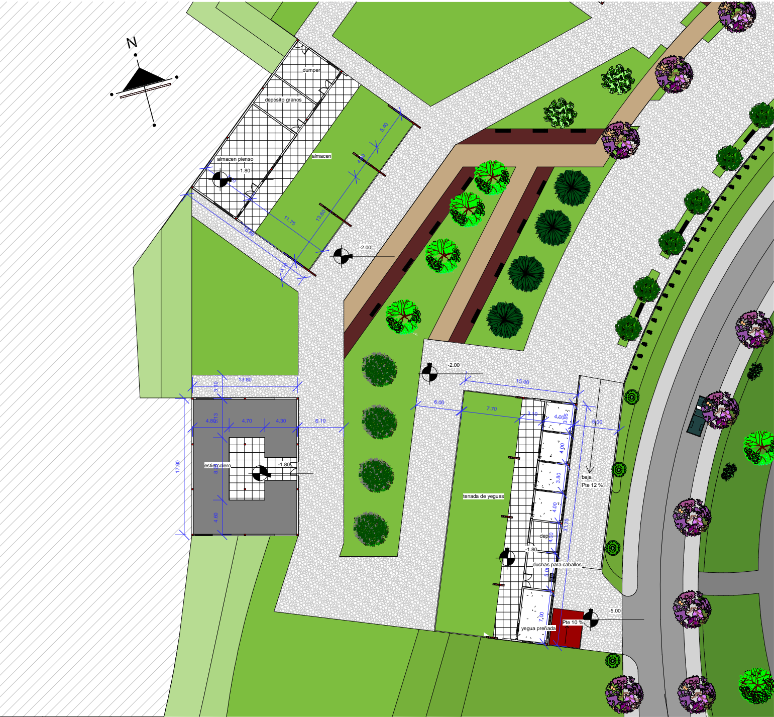
PLANTA BAJA ACOTADA ESC 1 :500