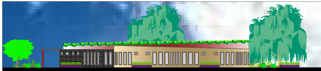
FACHADA SUPERIOR ESC: 1:100 ÁREA HABITACIONAL HOMBRES