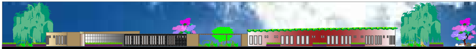
FACHADA SUPERIOR ESC: 1:100 ÁREA HABITACIONAL MUJERES