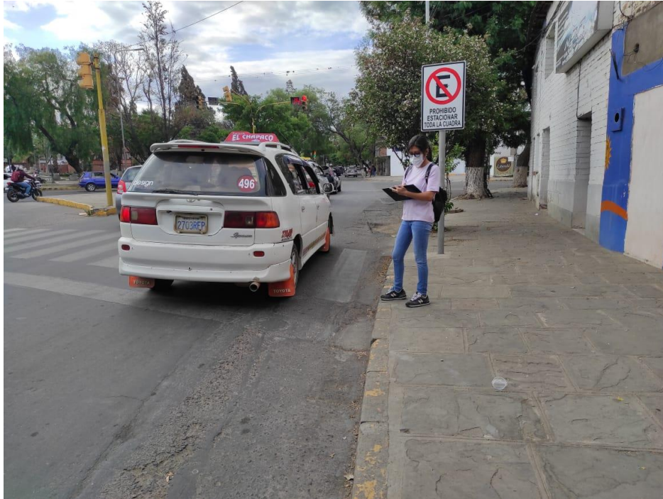
Fotografía 2: Congestionamiento vehicular en la rotonda San Martin