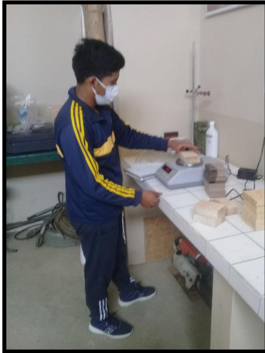
Control de Contenido de Humedad