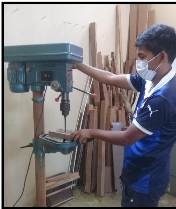
Ensayo de taladrado