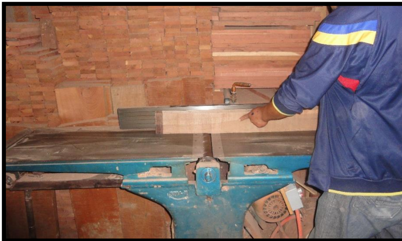
Ensayo de cepillado