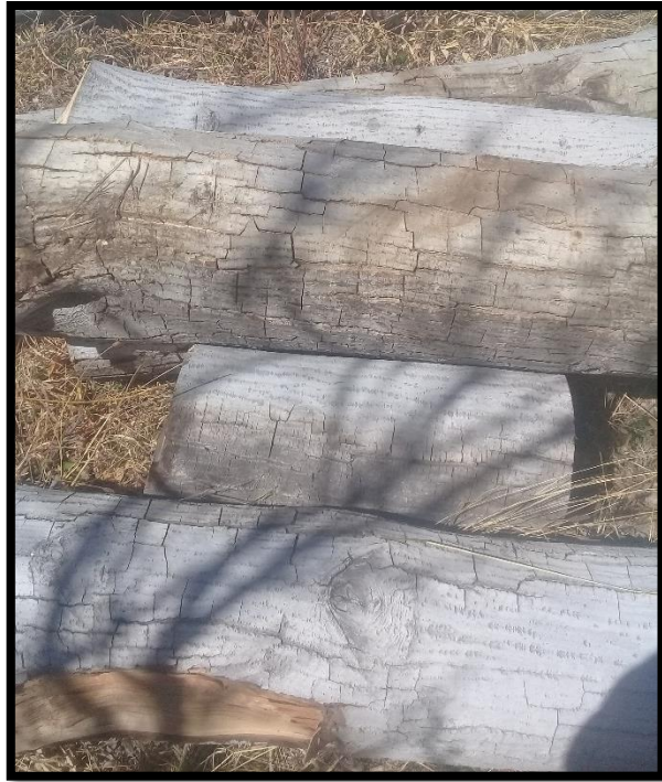
Obtención de las trozas