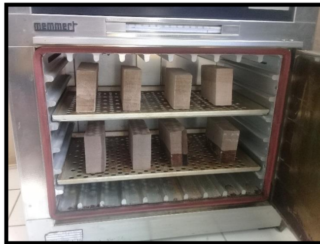
Control del CH mediante el método de las pesadas