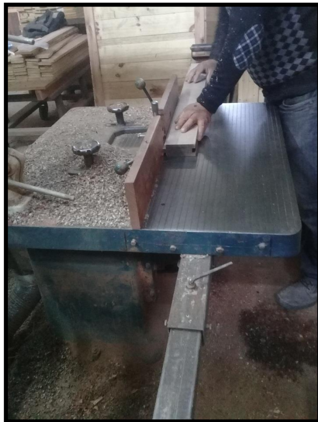
Ensayo de moldurado