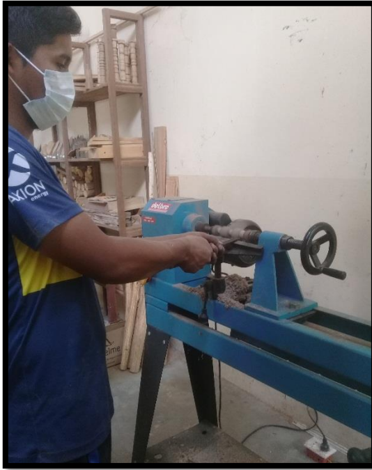
Ensayo de torneado