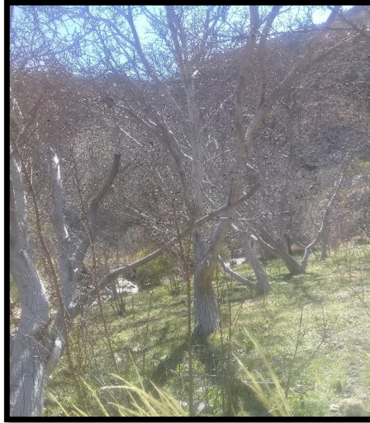
Plantación de Nogal