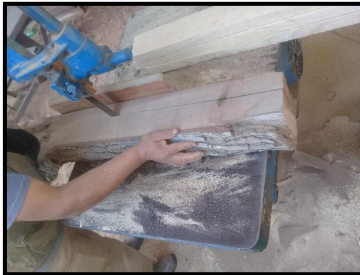
Aserrío de las trozas para obtención de probetas