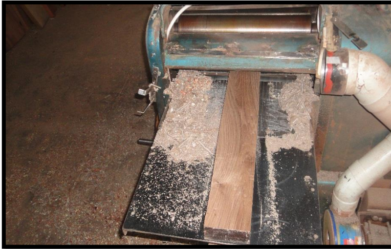
Ensayo de cepillado