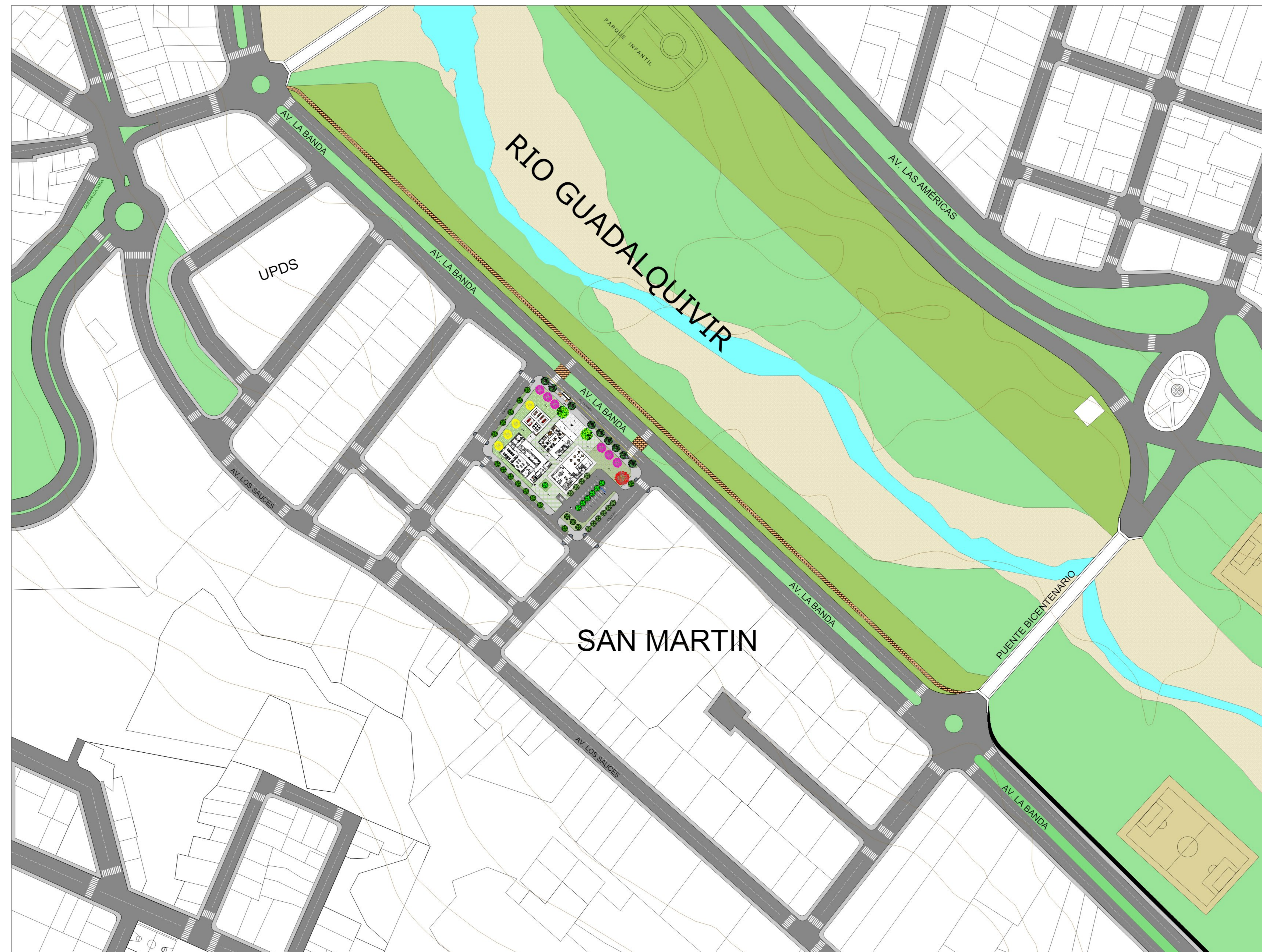
PLANIMETRÍA GENERAL Esc. 1:1000