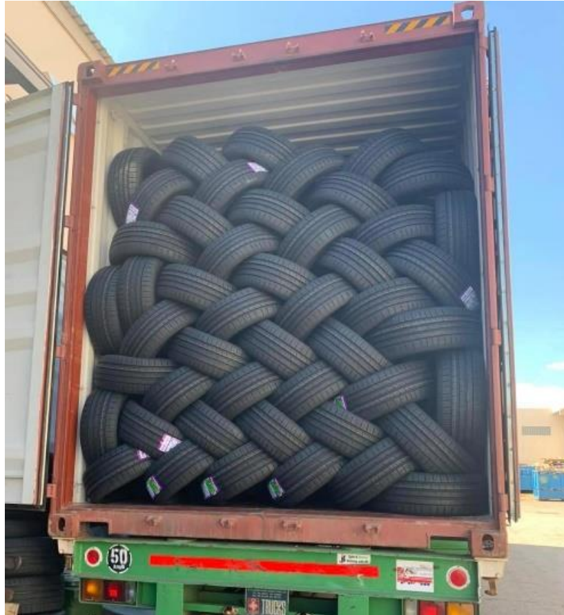
GRÁFICA N° 31. Contenerización