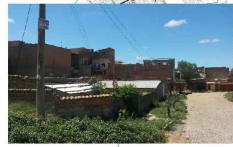
Falta de tratamiento paisajístico en calles y avenidas.