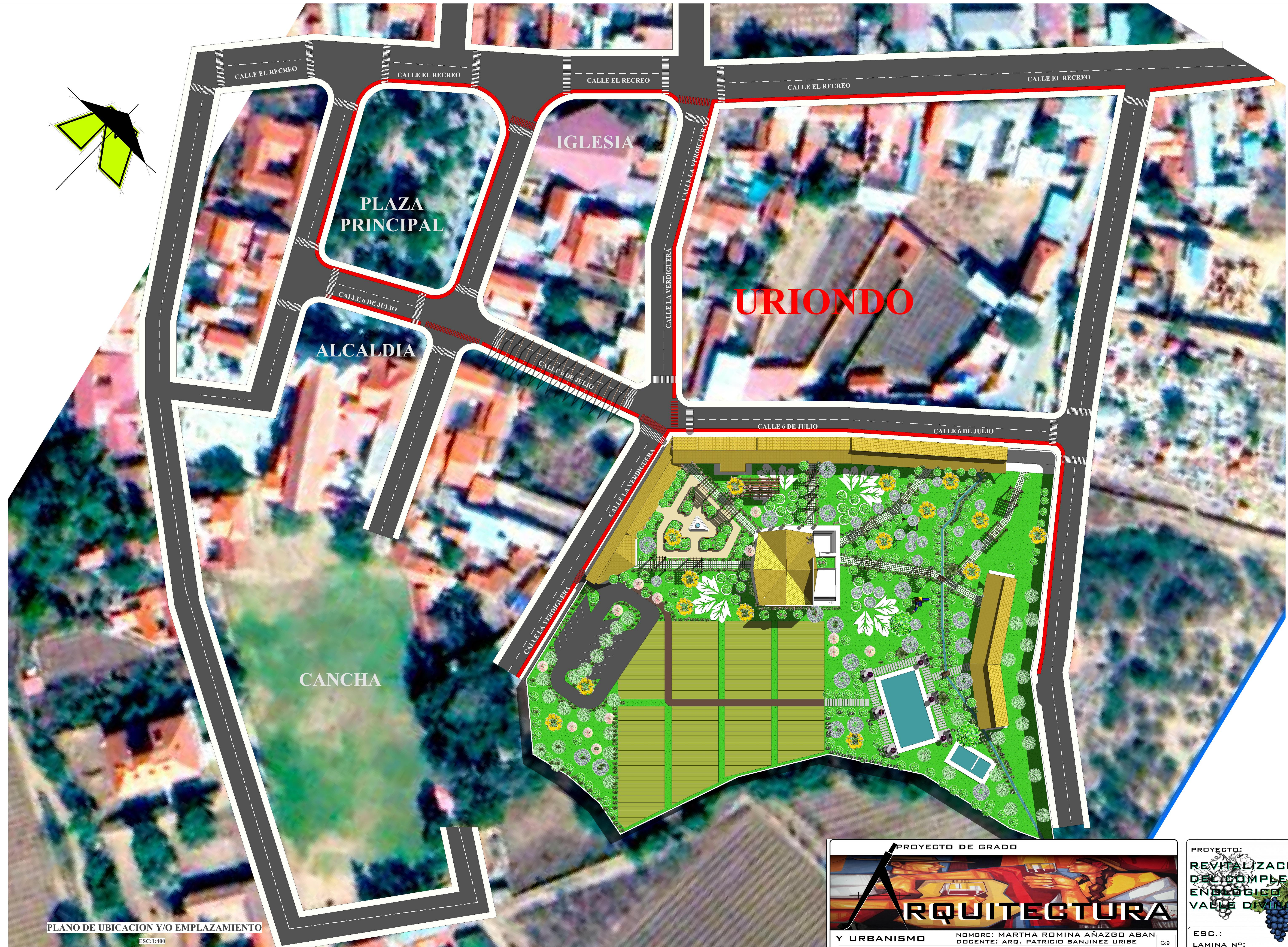
PLANO DE UBICACION Y/O EMPLAZAMIENTO ESC:1:400