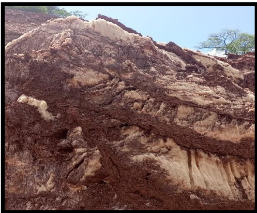
Bancos de sal