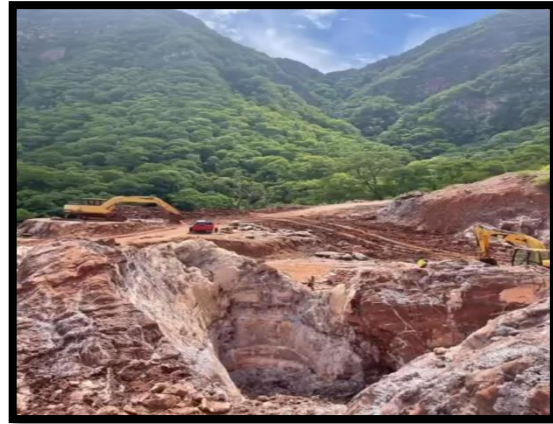
Descubrimiento de nuevos bancos de sal colorada "MASACARA"