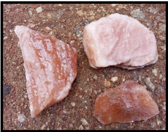
Sal colorada de exportación