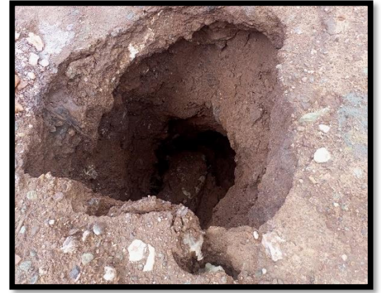
Consecuencias de la lluvia