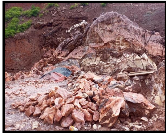
Sal colorada para transportar