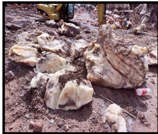
Sal de descarte