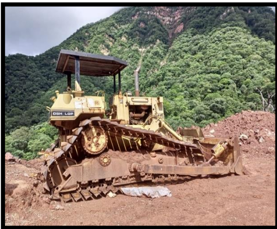
Maquina en desuso