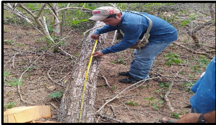
Fotografía N° 2 Selección de trozas con sus respectivas medidas