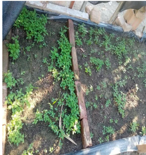
GERMINACIÓN EN ALMACIGUERA