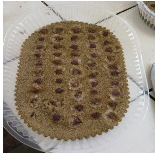
SIEMBRA EN BANDEJA PARA PARA ENSAYO