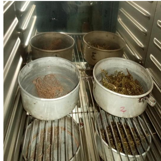
SECADO DE LA RAÍZ Y LA PARTE AÉREA DEL PLANTÍN