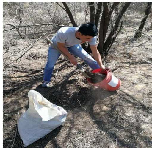
EXTRACCIÓN DE ABONO VEGETAL