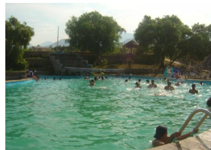
Cascada y cabañas