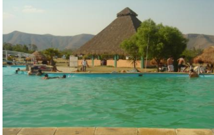
Cabaña principal y piscina