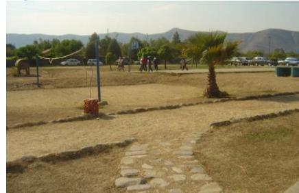
Canchas de bolybol, básquet, futbol y mesas de pin pon

ERQUIS SUR A 11 KM DE LA CIUDAD DE TARIJA