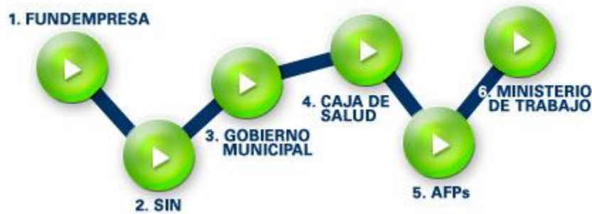
Imagen N° 8