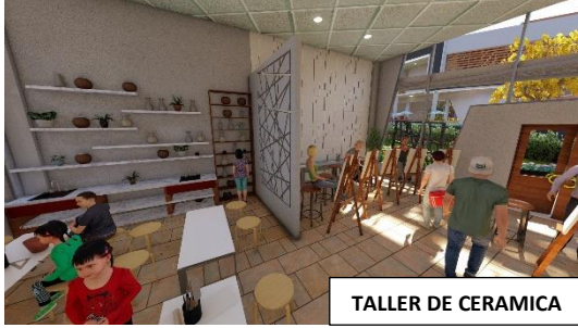
TALLER DE CERAMICA