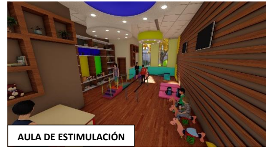
AULA DE ESTIMULACIÓN