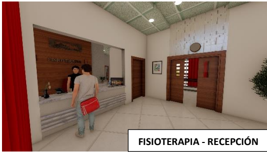
FISIOTERAPIA - RECEPCIÓN