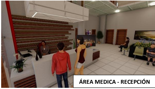
ÁREA MEDICA - RECEPCIÓN