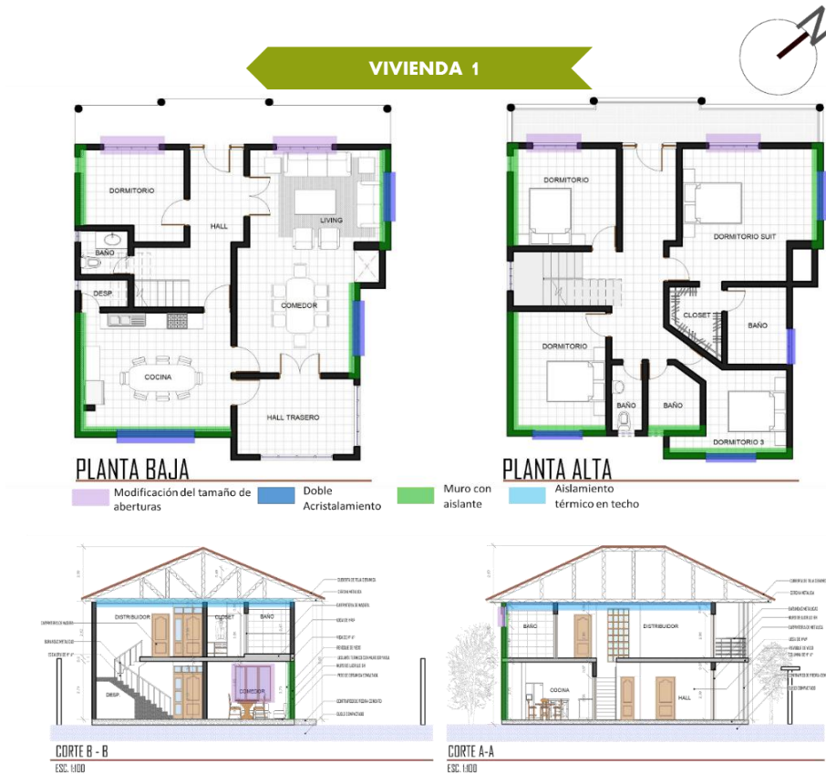
Imagen 27 Planos arquitectónicos de la vivienda 1 (Intervenido)