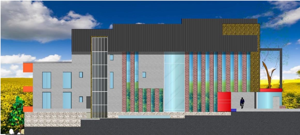
FACHADA LATERAL ESTE Esc. 1: 100