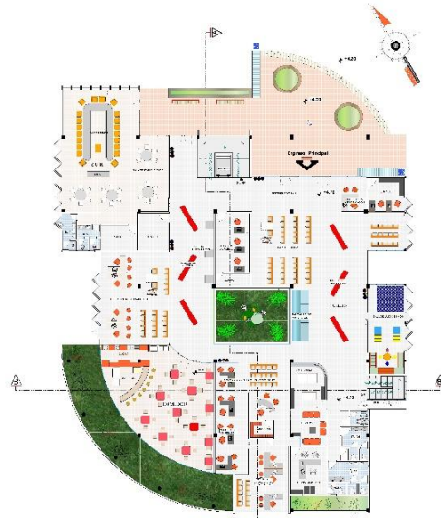
PLANO PLANTA BAJA ESC. 1: 100