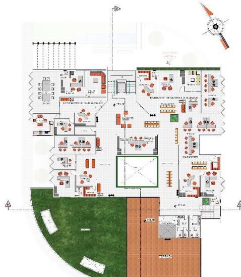
PLANO SEGUNDO PISO ESC. 1: 100