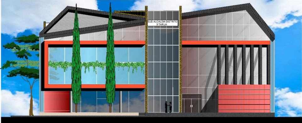
FACHADA PRINCIPAL NORTE Esc. 1: 100