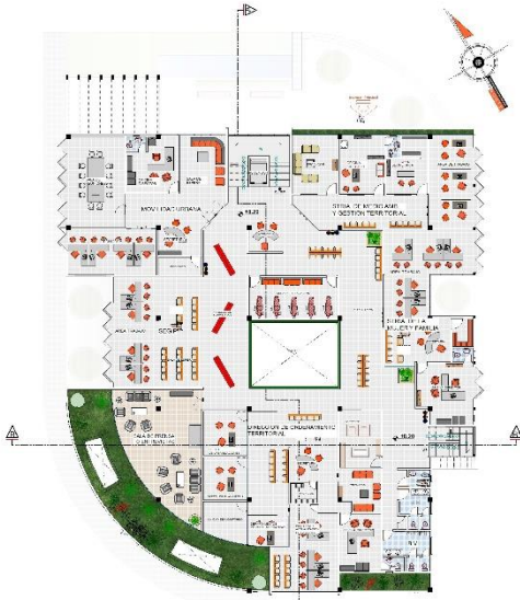
PLANO PRIMER PISO ESC. 1: 100