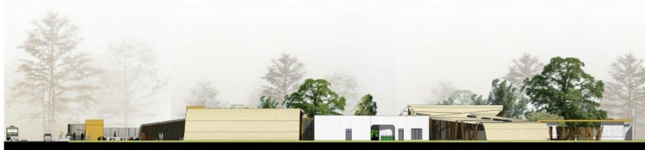
FACHADA LATERAL DERECHA