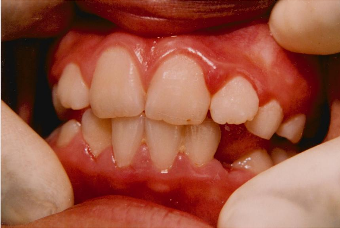
17).- Gingivitis margino-papilar crónica. Obsérvese las papilas interdentarias inflamadas, rojas, lisas y brillantes.