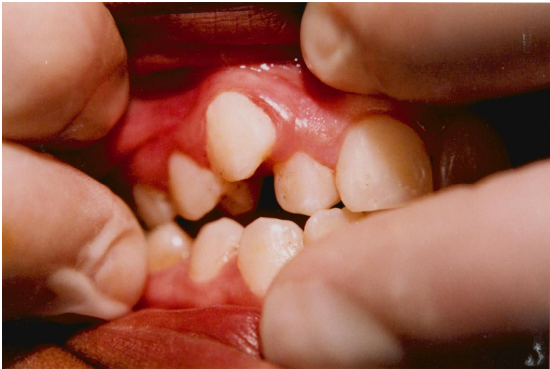
28).- Inflamación gingival asociada con la erupción de dientes en malposición.