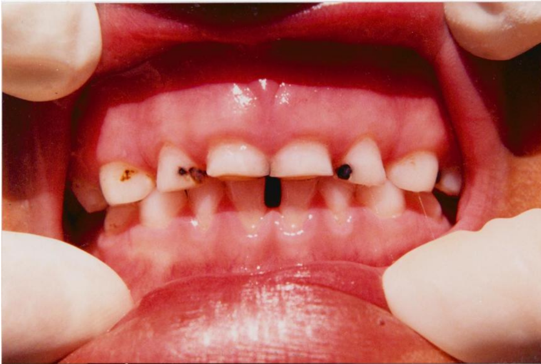
11) Gingivitis incipiente. Obsérvese el estado de la papila dental entre los incisivos inferiores debido al diastema que permite la impactación alimentaria