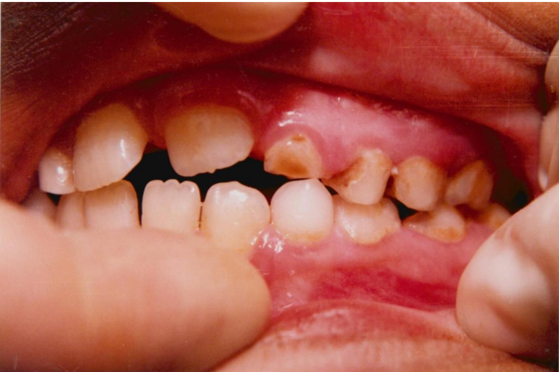
30).- Gingivitis asociada con erupción dentaria. El margen gingival es prominente, redondeado e inflamado en torno al incisivo lateral superior en erupción. Obsérvese el acúmulo de placa más abundante en los dientes primarios