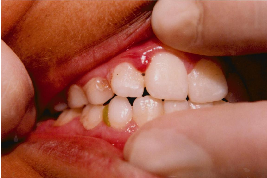
3).- Gingivitis margino-papilar asociada al acúmulo de placa y materia alba más abundante cerca de la encía. Obsérvese la papila entre el incisivo central y lateral superior inflamada hiperplásica, edematosa, roja, lisa y brillante.