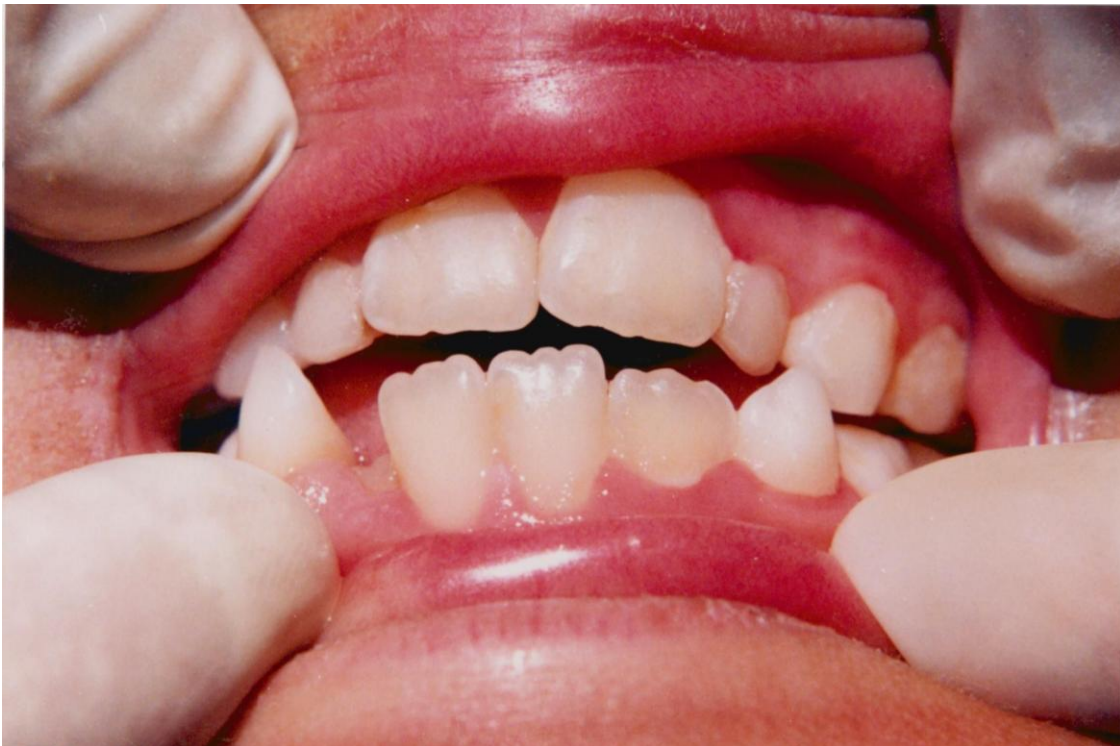
20).- Gingivitis asociada con erupción dentaria. Obsérvese el acúmulo de placa y materia alba.