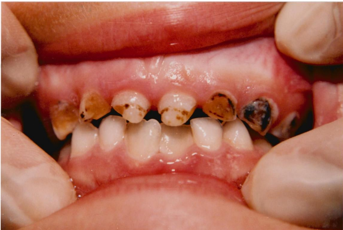
18).- Gingivitis localizada en el sector antero-inferior asociada con erupción dentaria. Obsérvese la encía inflamada, edematosa, roja, lisa y brillante en torno a los incisivos inferiores en malposición.