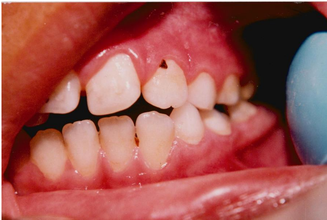
6).- Gingivitis asociada con erupción dentaria.- Obsérvese el margen gingival prominente, redondeado, inflamado y edematosa en torno al incisivo central superior en erupción.