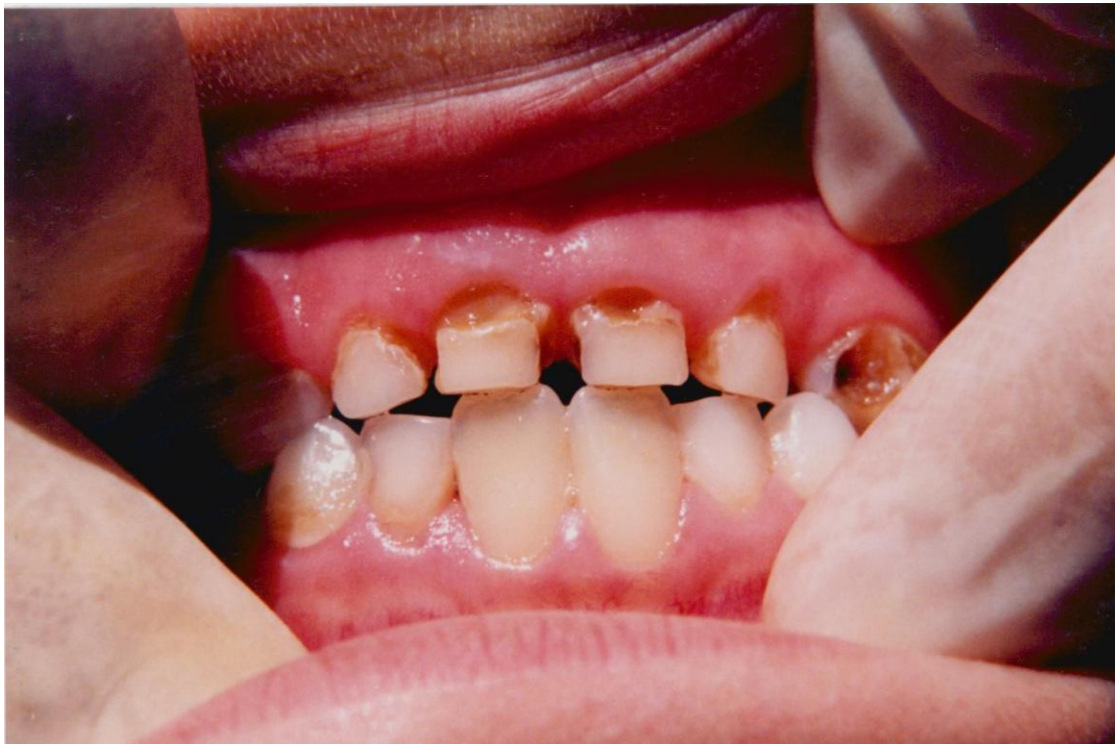
10).- Gingivitis margino-papilar generalizada asociada con caries cervical, acumulación de placa.