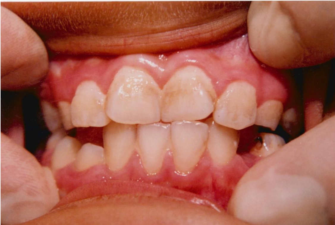
8).- Materia alba y placa generalizada en toda la boca con acumulación más abundante cerca de la encía. Obsérvese la inflamación gingival.