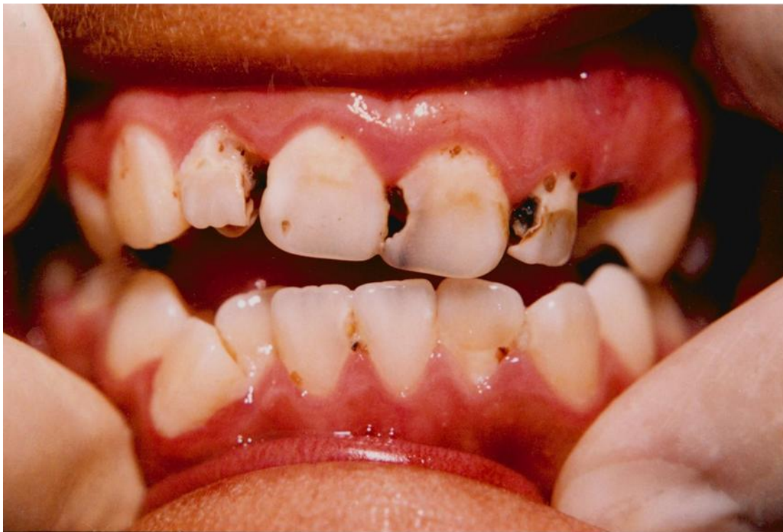
4).- Gingivitis marginal generalizada asociada con materia alba, placa, caries y mal posición dentaria.