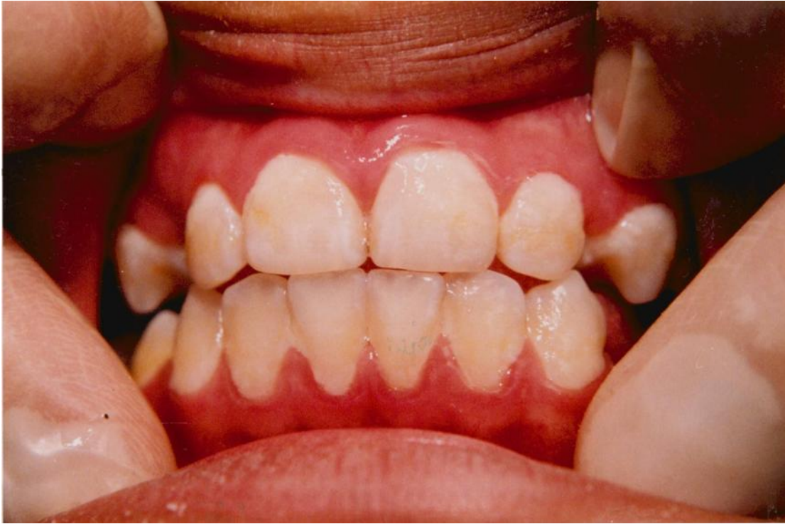
27).- Gingivitis marginal generalizada. Obsérvese la acumulación de placa.