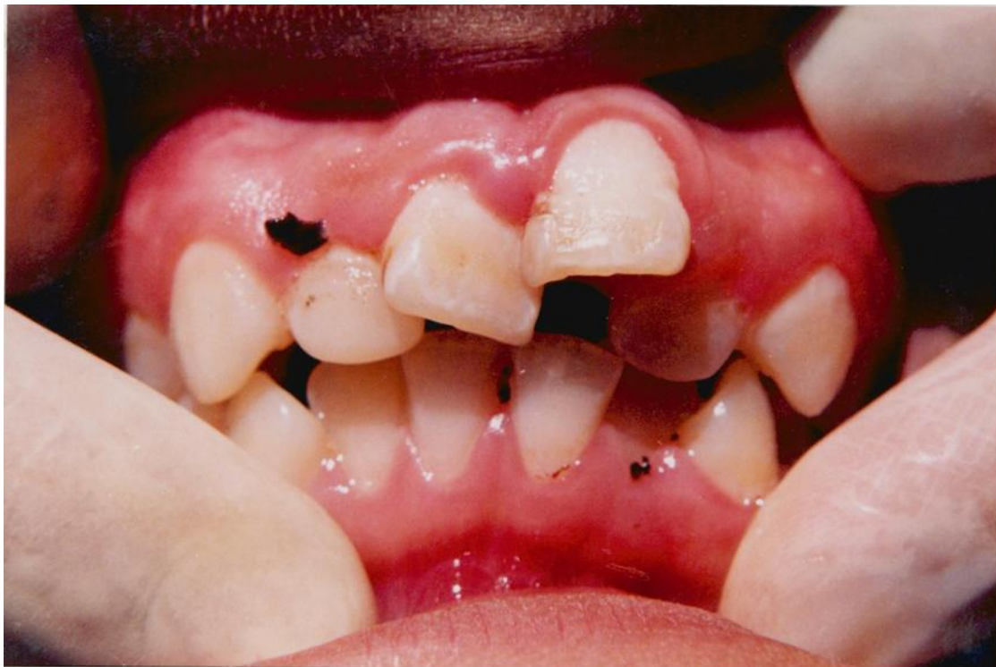
2).- Inflamación gingival y agrandamiento asociado con la acumulación de placa en torno a dientes en mal posición y mala higiene oral.