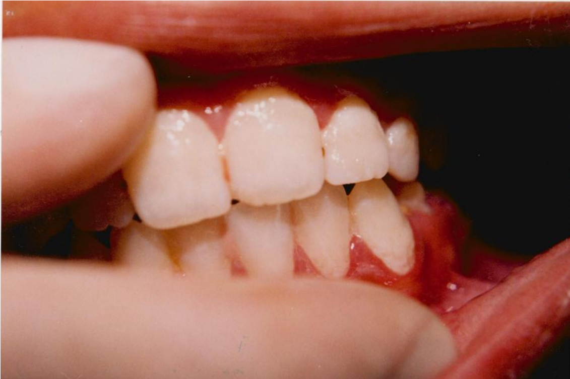
23).- Gingivitis crónica generalizada. Obsérvese el acúmulo de placa más abundante cerca de la encía.