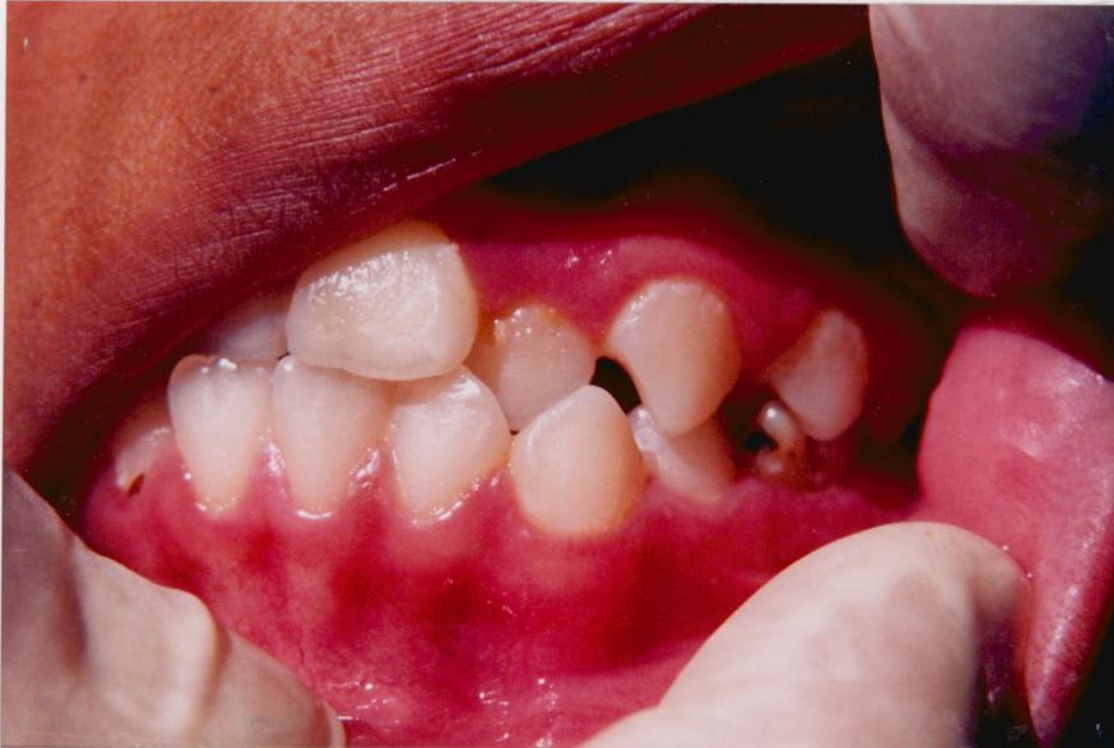
13).- Gingivitis marginal asociada a la acumulación de placa en torno a dientes en mal posición.