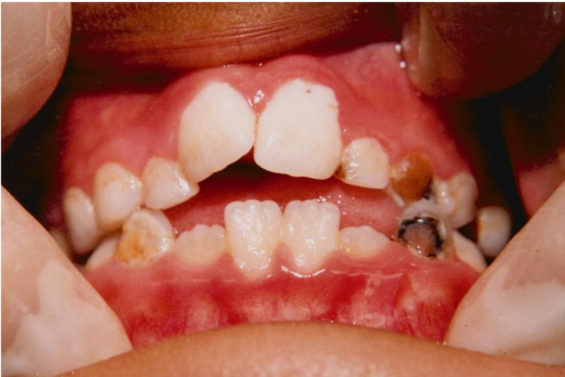
16).- Gingivitis margino-papilar crónica en un paciente con dentición mixta. Obsérvese la acumulación de placa, materia alba y la caries en dientes primarios.