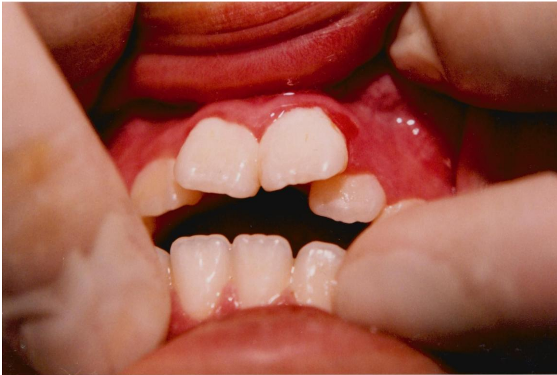
14).- Inflamación gingival con hemorragia asociada con dientes en mal posición.