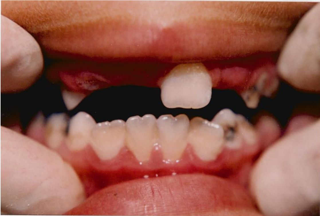
31).- Gingivitis marginal asociada con erupción dental.