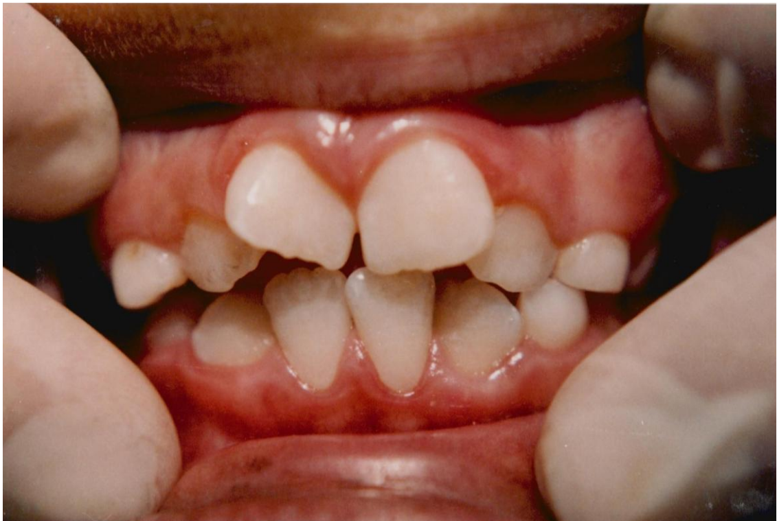
24).- Gingivitis asociada con erupción dentaria. Obsérvese la encía prominente y algo inflamada en torno a los incisivos permanentes parcialmente erupcionados.