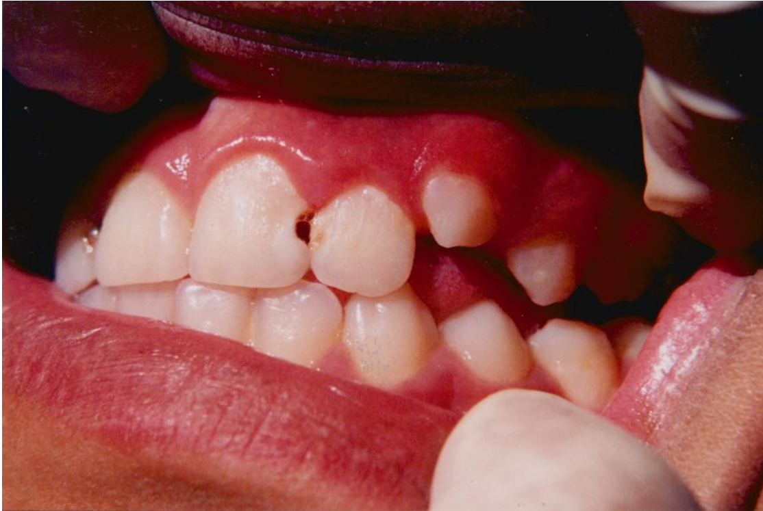
19).- Inflamación gingival. Obsérvese la encía marginal e interdental abultada, rojiza y edematosa.