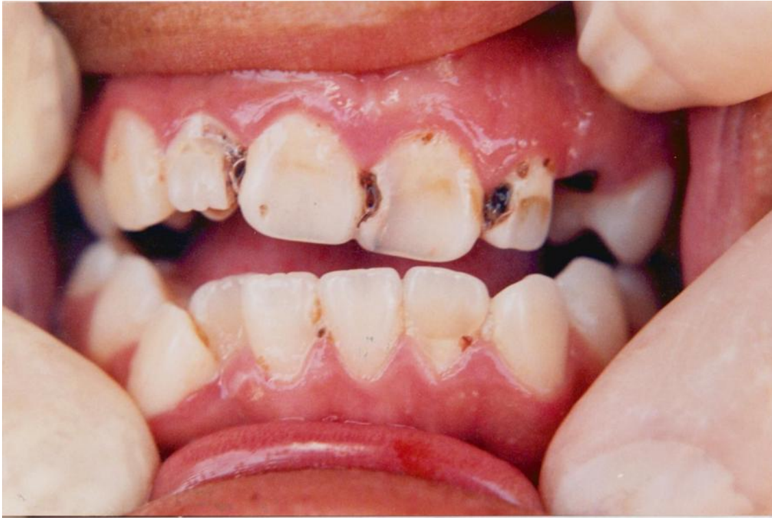
7).- Gingivitis marginal generalizada asociada con la acumulación de placa y materia alba más abundante cerca de la encía.