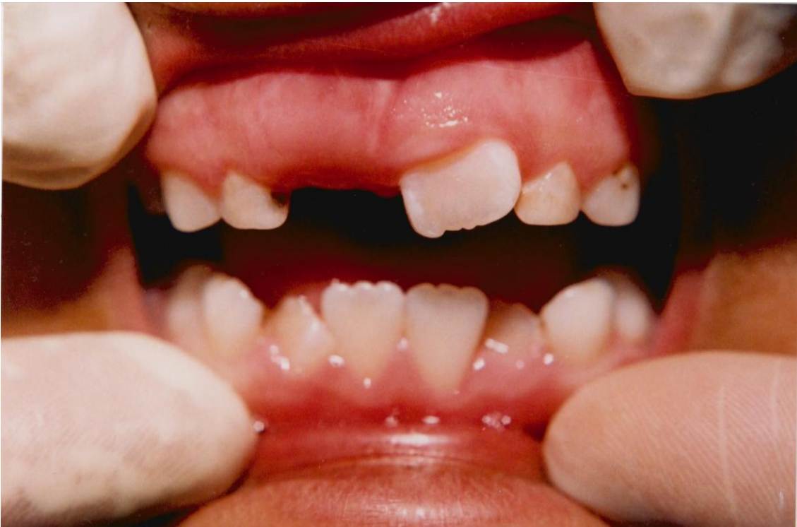
26).- Formación del margen gingival (arcada superior). Gingivitis asociada con la erupción de dientes en malposición (arcada inferior).