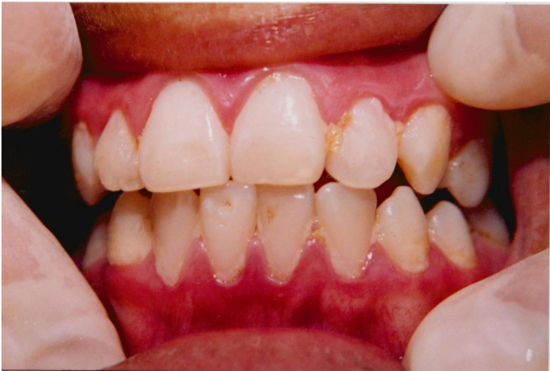
22).- Gingivitis crónica asociada con la acumulación de placa y materia alba. Obsérvese la inflamación generalizada del margen gingival y las papilas interdentarias.