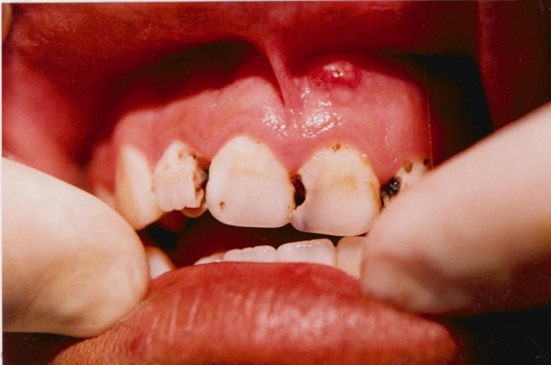
9).- Inflamación de la porción insertada de la encía asociada con caries de 4º grado (incisivo central superior izquierdo)