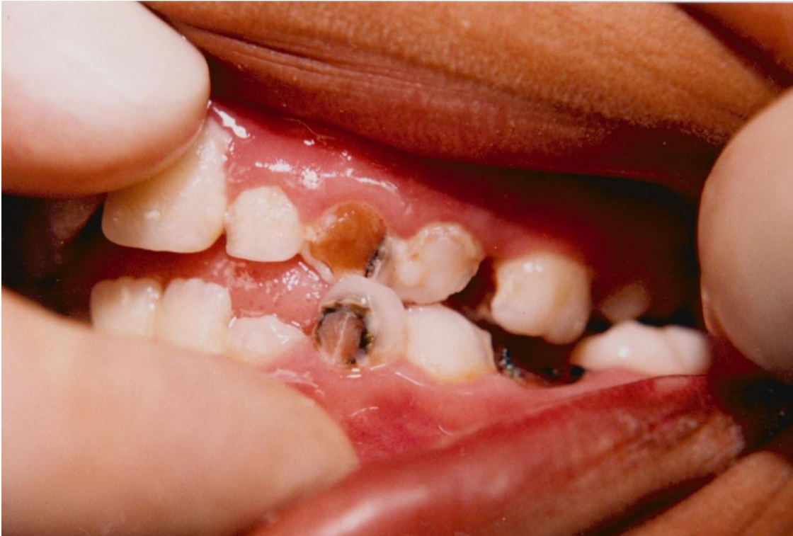
15).- Gingivitis marginal crónica asociada con acúmulo de placa, materia alba y caries.