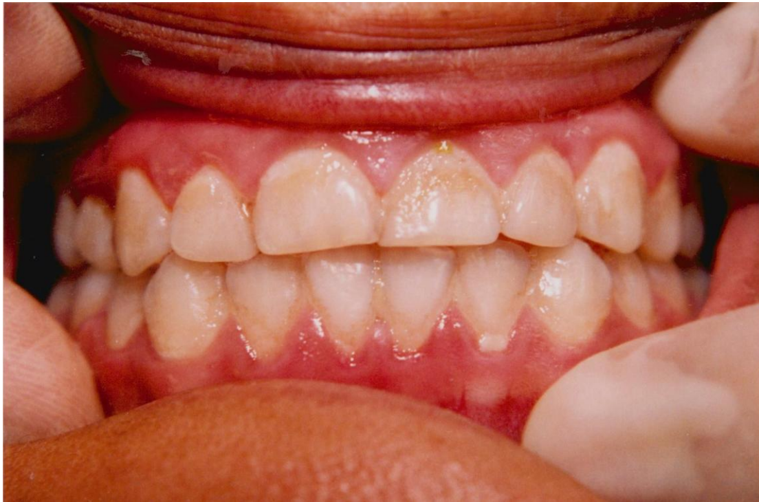
12).- Gingivitis crónica margino-papilar generalizada asociada con abundante acumulación de placa y materia alba.