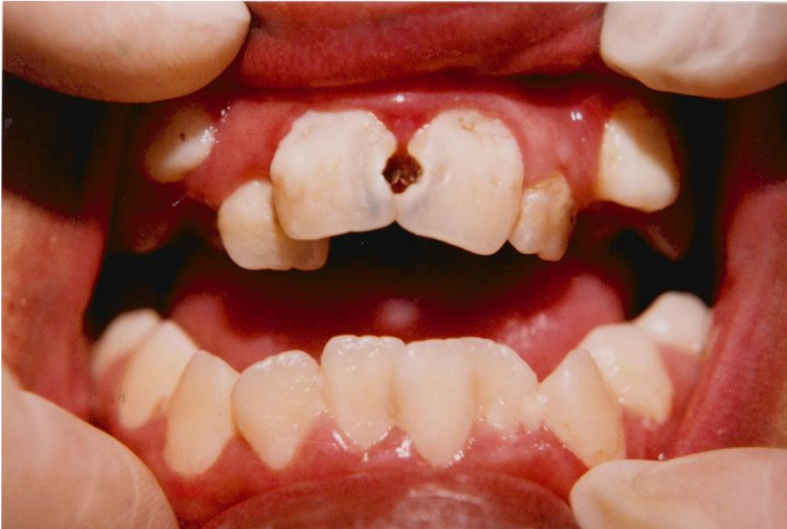
1).- Gingivitis margino-papilar generalizada en un paciente con mordida abierta asociada con la acumulación de placa y materia alba más abundante cerca de la encía. Obsérvese la encía inflamada, edematosa, roja, brillante y lisa.