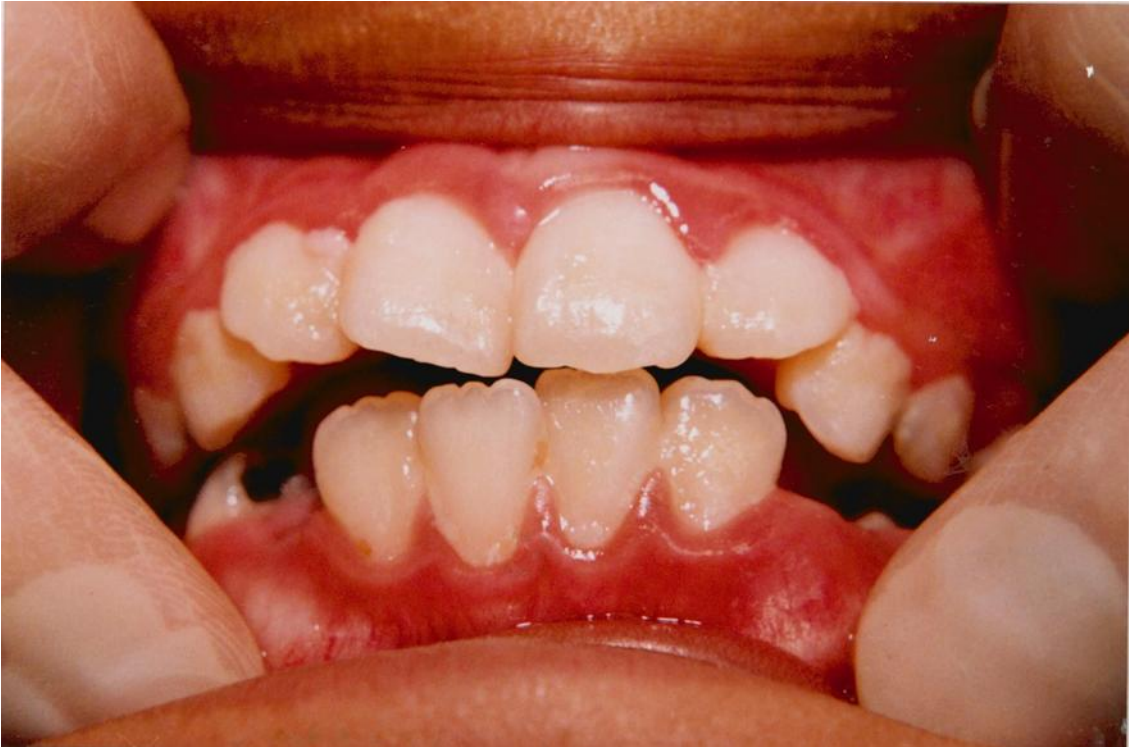
25).- Gingivitis crónica margino-papilar asociada con la acumulación de placa en torno a los dientes en malposición.