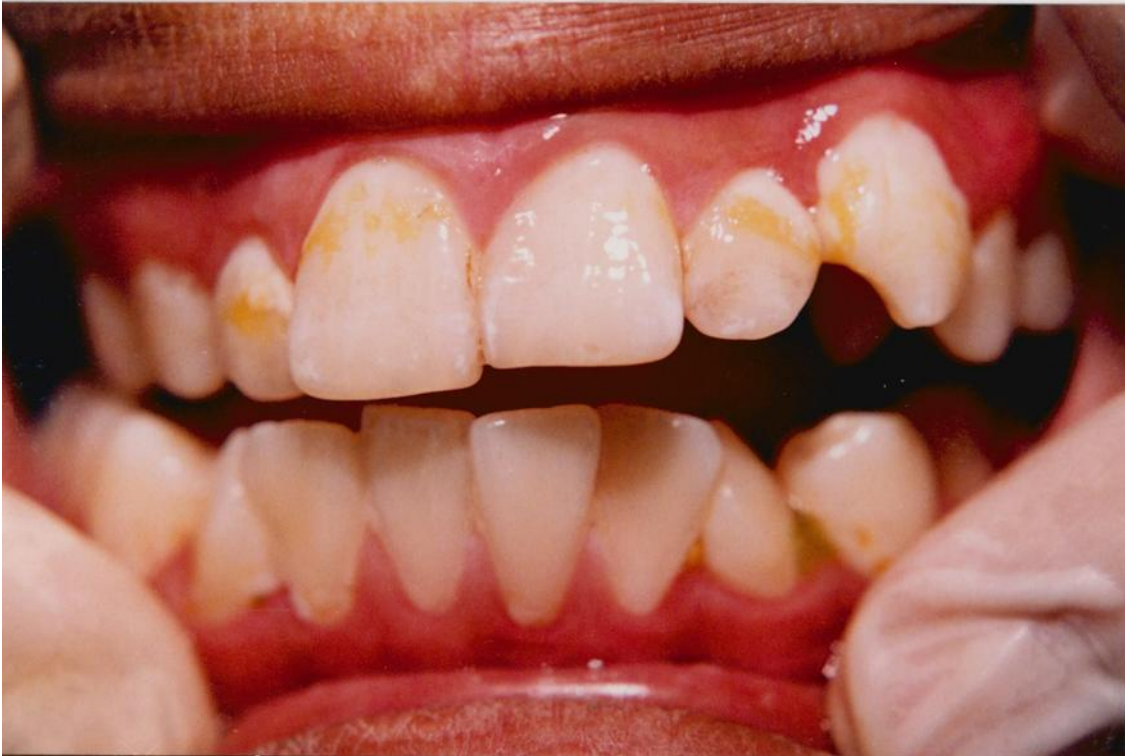
29).- Gingivitis marginal asociada con el acúmulo de placa y materia alba más abundantes cerca de la encía.