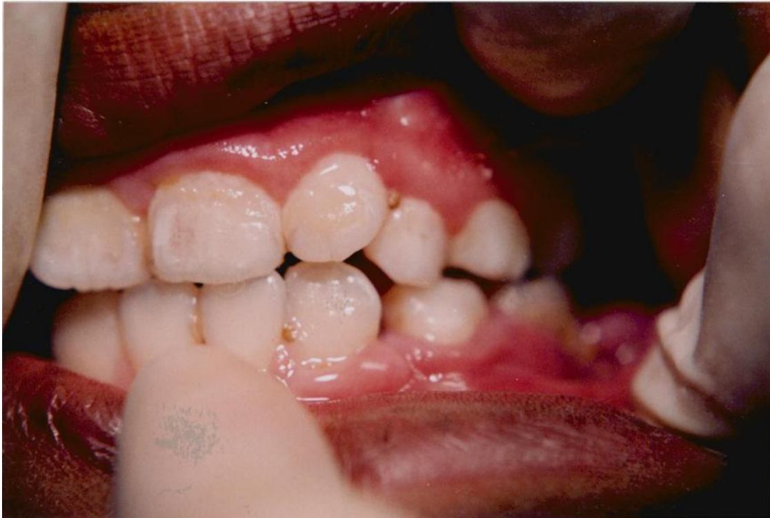
21).- Gingivitis asociada con erupción dentaria. El margen gingival es prominente, redondeado y algo inflamado. Obsérvese la acumulación de placa y materia alba.