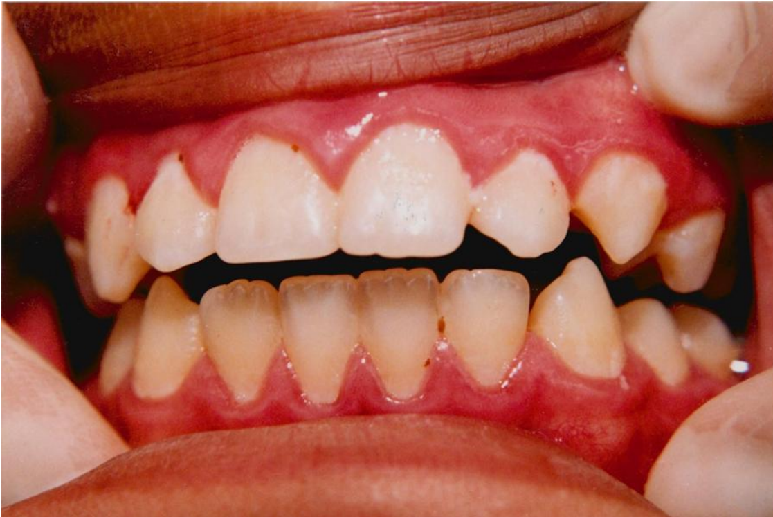
5).- Gingivitis marginal generalizada asociada con el acúmulo de placa y materia alba.