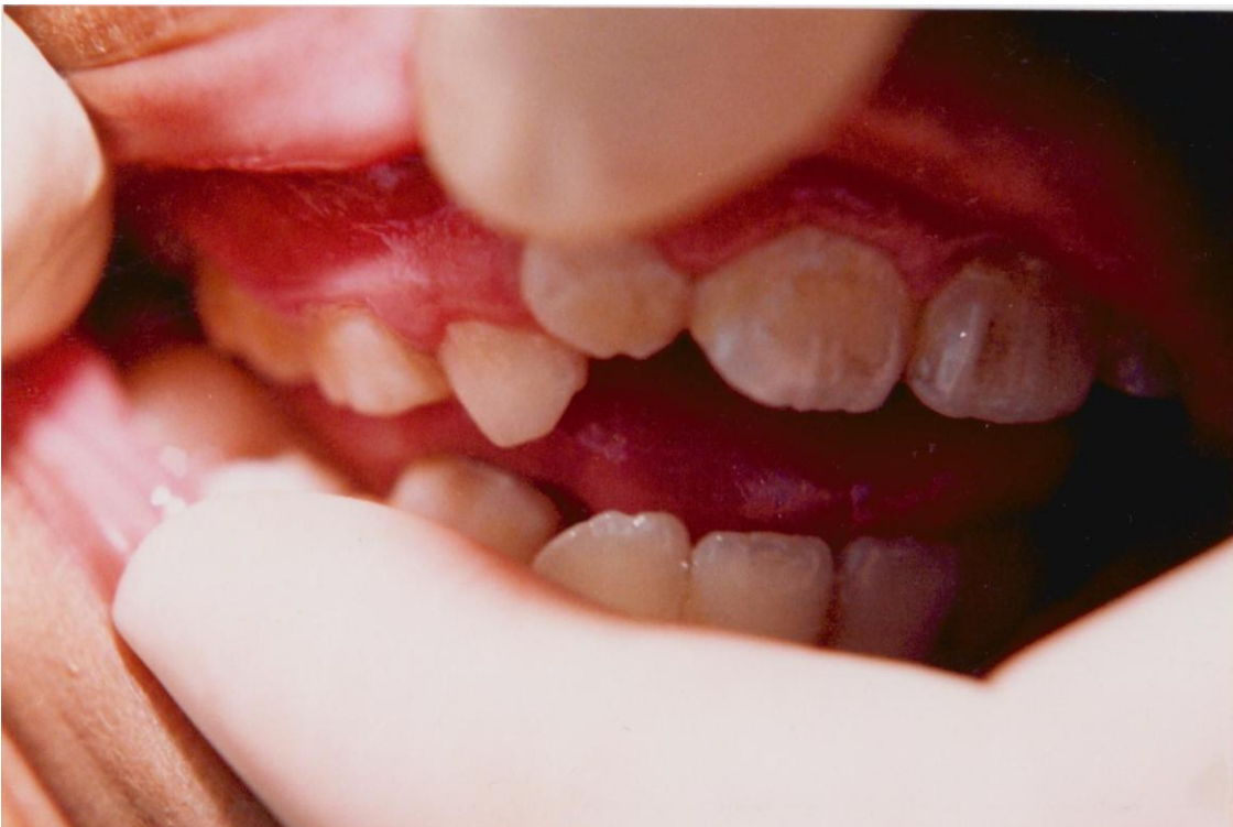
32).- Gingivitis generalizada asociada con erupción dentaria y acúmulo de irritantes locales. Obsérvese la encía inflamada, edematosa y rojiza.