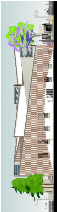
FACHADA LATERAL NOR-ESTE