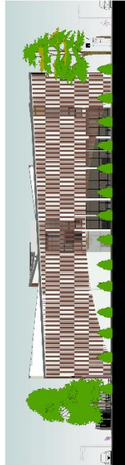
FACHADA LATERAL NOR-OESTE