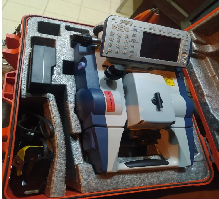
Estacion, trípode y prisma